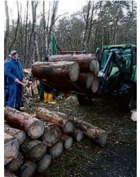
Nachschub kommt per Traktor.