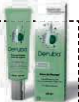
(Abbildung Betroffenen nachempfunden)

Für Ihre Apotheke: Deruba (PZN 11008068) www.deruba.de