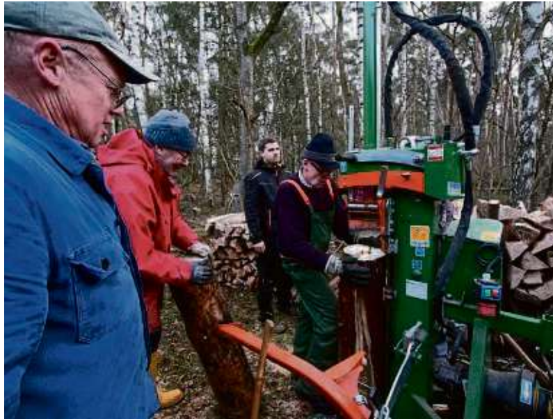
Mit 16 Tonnen Druck spaltet die Maschine fast jeden Stamm.

Doch manchmal sind auch 16 Tonnen Druck zu wenig. In einem 80 Zentimeter dicken Buchenstamm bleibt der stählerne Keil stecken. Er geht weder vor noch zurück. Nachdem die ersten Versuche keinen