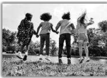
Kinder und Jugendliche haben eigene Rechte. Dies sollte auch für ihre Gesundheit gelten.

(djd-p). So steht es zumindest in der UN-Kinderrechtskonvention. Doch die Realität ist leider eine andere: Längst nicht alle Kinder haben Zugang zur bestmöglichen Gesundheitsversorgung – auch in Deutschland. Um die Arzneimittelversorgung unserer rund 14 Millionen Kinder und Jugendlichen zum Beispiel ist es nicht gut bestellt: Häufig gibt es keine eigens für sie zugelassene Therapie. Viel zu oft müssen Kinderärzte auf Erwachsenenmedizin zurückgreifen. Das birgt Risiken, denn die Präparate sind nicht auf den kindlichen Stoffwechsel angepasst, Nebenwirkungen können gravierender ausfallen. Zudem fehlt es an klinischen Studien für diese Altersgruppe. Sie sind Voraussetzung dafür, dass Kindermedikamente zugelassen werden. „Neue Wirkstoffe müssen genauestens