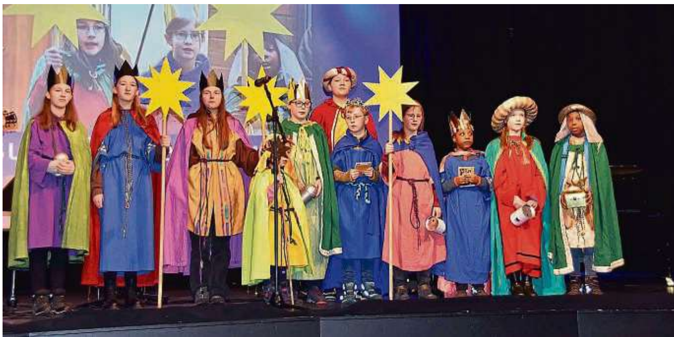
Die Sternsinger der katholischen St. Martin Gemeinde überbrachten auch in diesem Jahr ihren Segen und sammelten Geld.

Anzeigenpreis nach Preisliste 63 vom 1. 1. 2024 Falls Sie diese Zeitung nicht mehr erhalten möchten, bitten wir Sie einen Werbeaufkleber mit dem Zusatzhinweis „bitte keine kostenlosen Zeitungen“ an Ihrem Briefkasten anzubringen. Ideal wäre auch ein Hinweis unter Angabe Ihrer Anschrift auf www.stadtpost.de unter dem Reiter Zustellung, damit wir unsere Träger informieren können.