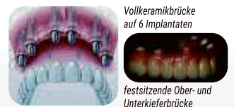
Vollkeramikbrücke auf 6 Implantaten

Implantate geben verloren gegangene Lebensqualität zurück. Bereits mit 6 Implantaten lassen sich festsitzende Keramikbrücken in einem zahnlosen Kiefer sicher und dauerhaft auf Implantaten befestigen. Mit 12 Implantaten ist bei totaler Zahnlosigkeit wieder ein komplett festsitzender Zahnersatz möglich. Dieser Zahnersatz muss dann nicht mehr herausgenommen werden und bleibt dauerhaft im Mund, wie einst die eigenen Zähne. Der Biss in den Apfel ist wieder möglich. 6 Implantate führender Implantathersteller, mit High-Tech Zahnersatz aus hochfester Zirkonoxidkeramik, liegt im Kompetenzzentrum für Implantologie bei ca. 12.000 Euro.