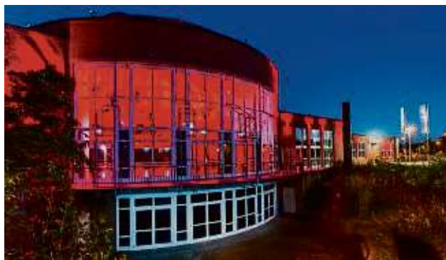
Das Dietzenbacher Capitol ist Veranstaltungsort für viele Kunstschaffende und Shows. Die Stadt möchte mehr über die Vorlieben des Publikums erfahren.

Die ermittelten Daten ermöglichen wichtige Rückschlüsse auf die verschiedenen Zielgruppen des Veranstaltungshauses, heißt es. Da-