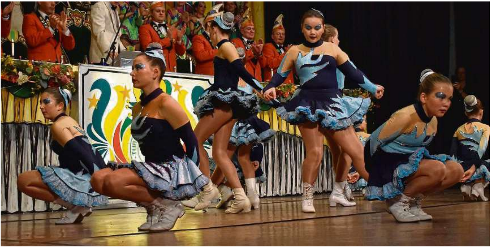
Sorgt für strahlende Augen: die Midi-Garde der TG Ober-Roden.