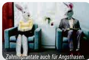
Zahnimplantate auch für Angsthasen.

Schlafend ohne Angst durch die Zahnimplantation