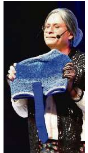
„Fräulein Kokolores“ präsentierte gestrickte Bademoden.

und einige Takte darauf abfahren zu können.