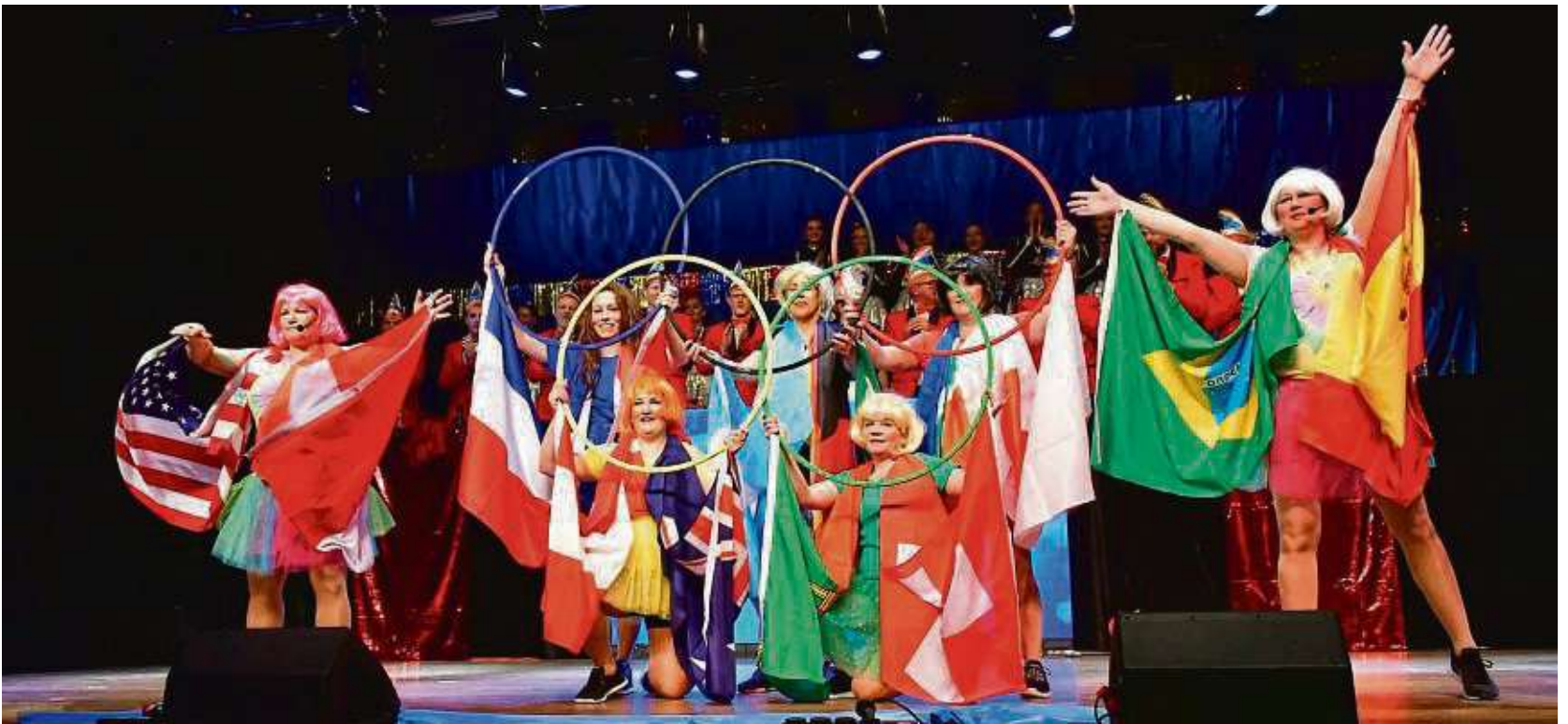
Die „Alte Garde“ war bei der Gala-Fastnachtssitzung der Turngemeinde Nieder-Roden olympisch drauf.