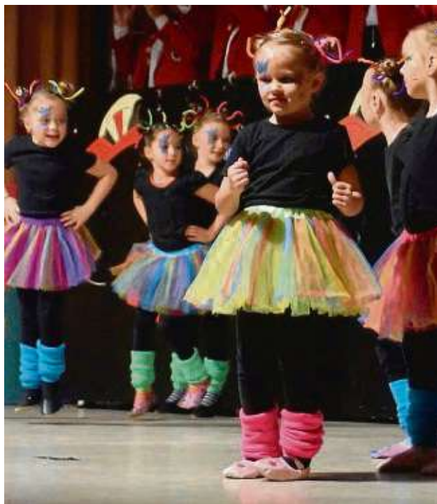
Auftritt noch rechtzeitig vorm Schlafengehen: Die allerjüngsten Tänzerinnen, die Mini-Garde, standen gleich am Anfang auf der Bühne.