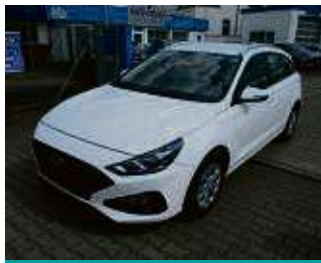
Hyundai i 30 Kombi. Bj. 21, viele Extras, 50.000 KM, 14.750 €. Autohaus Müller, Industriestr. 7, 63150 Heusenstamm, ☎ 06104-8024444