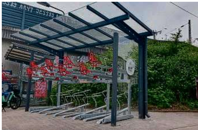
Überdachte Abstellmöglichkeit: Die neue Doppelstockanlage für Fahrräder am Lokalbahnhof.

Sachsenhausen (red) – Mit Rad und Bahn zum Ziel – am Lokalbahnhof in Sachsenhausen bietet eine dritte Doppelstockanlage für Fahrräder ab sofort weiteren 16 Rädern eine überdachte Abstellmöglichkeit. Die zusätzlichen Stellplätze, die sich auch der Ortsbeirat schon lange gewünscht hatte, sind auf Flächen der Deutschen Bahn (DB) aus der Bike+Ride-Offensive (B+R-Offensive) entstanden. Dabei schaffen die Kommunen gemeinsam mit der DB mehr Platz für Fahrräder an Bahnhöfen. Ziel der Offensive ist es, das klimafreundliche Zusammenspiel von Fahrrad- und Bahnfahren zu fördern.