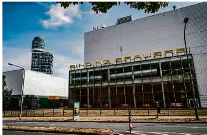
Gegen ein P+R-Parkhaus auf dem Binding-Gelände spricht laut Magistrat, dass es für Gewerbenutzung vorgesehen ist.

Gegen das Parkhaus auf dem Binding-Gelände spricht sich jetzt die Stadt aus. Dagegen spreche, dass das Areal als Gewerbefläche festgesetzt sei und die Gewerbenutzung auch weiterhin per Beschluss gesichert ist und vor Fehlnutzungen geschützt werden solle. „Von einer Prüfung, wie ein Parkhaus dort errichtet werden und als Umsteigepunkt dienen kann, sieht der