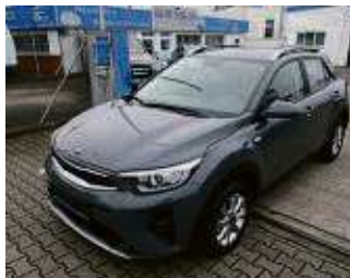
Kia Stonic.1.2i Bj. 21, Extras, 39.000 KM, 15.950 €. Autohaus Müller, Industriestr. 7, 63150 Heusenstamm, ☎ 06104-8024444