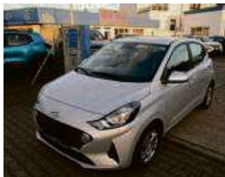
Hyundai i 10. Bj. 22, 25.000 KM, viele Extras, 12.450 €. Autohaus Müller, Industriestr. 7, 63150 Heusenstamm, ☎ 06104-8024444