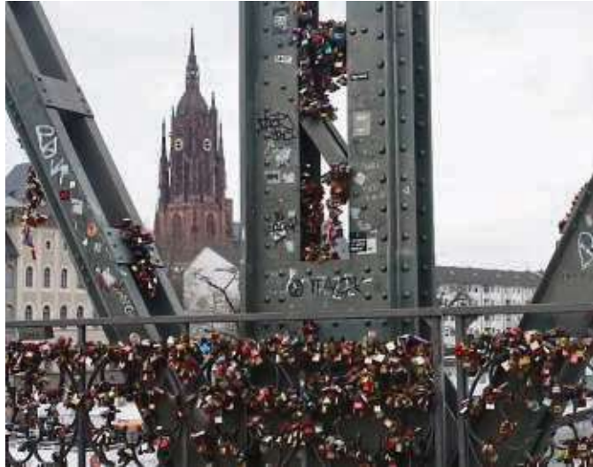
Unzählige Schlösser für die Liebe hängen am Eisernen Steg, die Paare gemeinsam angebracht haben. Vielleicht ja auch Ihres?

Interessant sind alle Geschichten, die Sie uns verraten