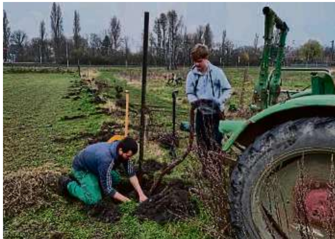
Die Vorbereitungsarbeiten für das zukünftige Staudenbeet sind bei Die Kooperative in vollem Gang.

Die landwirtschaftliche Genossenschaft Die Kooperative eG mit Sitz in Frankfurt Oberrad liefert wöchentlich rund 600 Bio-kisten regionales Bio-Obst und -Gemüse in 38 Depots in und um Frankfurt. Weitere Infos gibt es unter diekooperative.de .