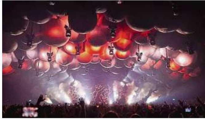
Die Time Warp verbindet visuelle Effekte mit dem Nonplusultra der elektronischen Musik – und das seit 30 Jahren.

Im Untergrund spielte Techno 1994 längst nicht mehr, elektronische Musik erlebte in Deutschland ihre erste Hochphase. Daher sollte die erste Time Warp auch kein Rave werden, wie es sie in den 90ern zu Tausenden gab, Gründer Steffen Charles wollte bereits mit der ersten Time Warp musikalisch zurück in den „Underground“. Das sollte sich im Programm widerspiegeln und im Namen: „Time Warp – zurück zur guten alten Zeit“, sagt Charles. Neben der musikalischen Ausrichtung spielte auch schon bei der ersten Party der Standort eine große Rolle: „Die