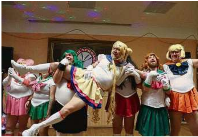
Das Männerballett der Concordia aus Kesselstadt brachte mit dem Showtanz „Sailor Moon“ den Saal zum Toben.

Sachsenhausen (red) – Das Salonorchester Salon Con Brio, geleitet von Markus Rölz, bietet am Sonntag, 17. März, um 18 Uhr in der St. Bonifatiuskirche, Holbeinstraße 70, ein unvergessliches Konzerterlebnis. Ausgewählte Künstler spielen auf neue und unkonventionelle Weise ihr Instrument in einem ganz besonderem Klangraum – in der Bonifatius Kirche mit ihrer eindrucksvollen expressionistischen Raumgestaltung. Zu Gehör gebracht werden bekannte Walzermelodien von Johann Strauss und berühmte Hits der 20er und 30er Jahre.