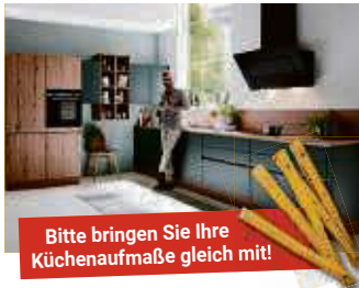
Bitte bringen Sie Ihre Küchenaufmaße gleich mit!

„Nur einmal im Jahr bieten wir unseren eigenen Mitarbeitern die Möglichkeit, zu deutlich günstigeren Preisen neue Möbel oder Küchen zu erhalten. Für uns ist das eine Selbstverständlichkeit und ein Zeichen des Dankes für den Einsatz unserer fleißigen Mit-