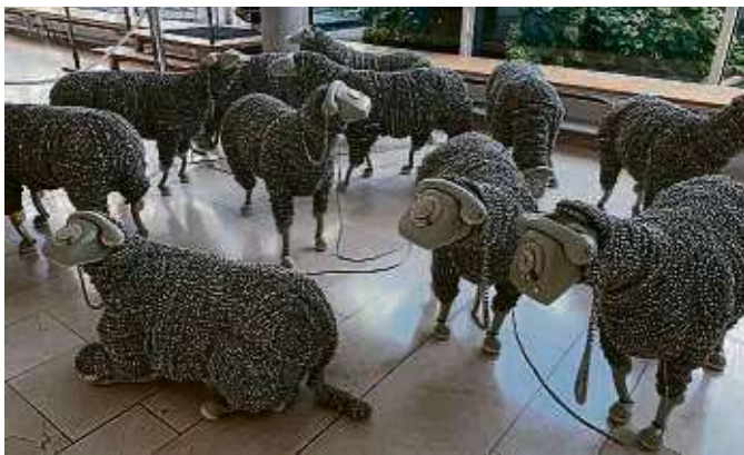
Im Museum für Kommunikation wird in der Veranstaltungsreihe „Frankfurter Schule“ die Frage gestellt „Wer ist autoritär?“