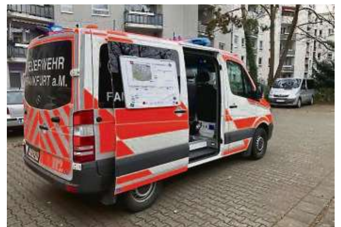
Rund 70 Einsatzkräfte waren mit insgesamt 26 Fahrzeugen vor Ort.