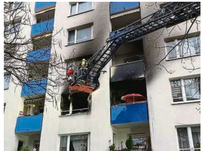
Die Feuerwehr bei der Kontrolle der Fassade des Wohnhauses mit Hilfe einer Drehleiter.

Der schwer verletzte Mann wurde unter anderem mit Verbrennungen in eine Offenbacher Klinik transportiert. Angehörige des Verletzten wurden seelsorgerisch betreut. Von Seiten der Feuerwehr und des Rettungsdienstes waren rund 70 Einsatzkräfte mit 26 Fahrzeugen vor Ort. Der Einsatz war nach gut zwei Stunden beendet. Durch die Polizei wird nun die Schadenshöhe und die Brandursache ermittelt. Zum aktuellen Gesundheitszustand des Verletzten wurden aus datenschutzrechtlichen Gründen keine Auskünfte gegeben.