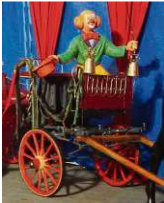
Das Zirkus-Museum zeigt historische Exponate und alte Wagen.