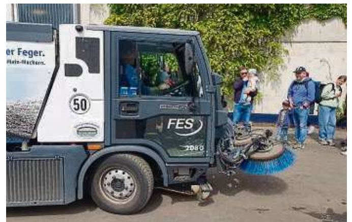
Eine Fahrt mit der Kehrmaschine ist für die kleinen Besucher des Komposttags ein großes Abenteuer.