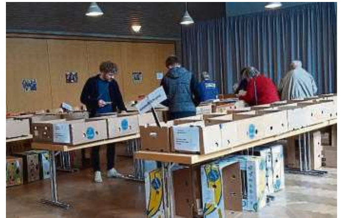
Die Besucher des Bücherbasars stöberten in der großen Auswahl an Romanen, Krimis und Kinderbüchern.

Der Erlös des Bücherbasars wird dem Projekt „Ägypten – Mädchen vor Beschneidung schützen“ zugeführt. Plan International Deutschland setzt sich aktiv für den Schutz von Mädchen in Ägypten vor schädlichen traditionellen Praktiken wie weiblicher Genitalverstümmelung und Frühverheiratung ein. „In den Regionen Sohag und Qena in Oberägypten, die zu den konservativsten und traditionellsten Gebieten des Landes gehö-