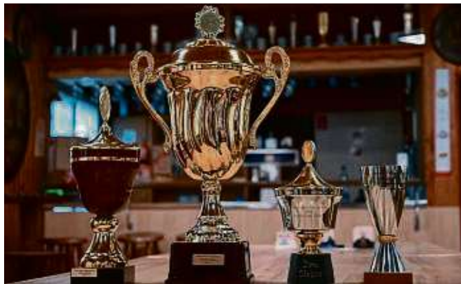
Die Pokale für das Wäldchesschießen warten auf ihre Empfänger.

Das Schießen beginnt am Freitag um 17 Uhr sowie von Samstag bis Dienstag je ab 14 Uhr. Es dauert jeweils bis 23 Uhr. Dabei wird mit Luftdruckwaffen des Vereins auf Zehn-Meter-Bahnen um zahlreiche Pokalpositionen sowie auf Wein-, Bembel- und Urkundenscheiben oder auch „nur so“ geschossen. Kinder von sechs bis elf Jahren können von Samstag bis Montag zwischen 14 und 17 Uhr ihre Treffsicherheit mit dem Lichtgewehr üben und