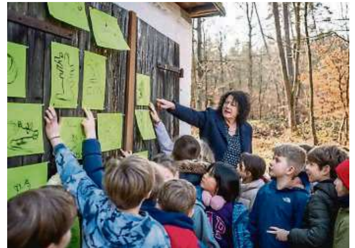
Die Klasse 3a der Textorschule präsentiert ihre Kohlezeichnungen des Grüngürtel-Tiers.

Der von den Dezernaten für Bildung, Immobilien und Neues Bauen sowie Klima, Umwelt und Frauen getragene „Bildungsraum Grüngürtel“ wird koordiniert durch das Stadtschulamt, das Grünflächenamt, das Umweltamt und den Verein