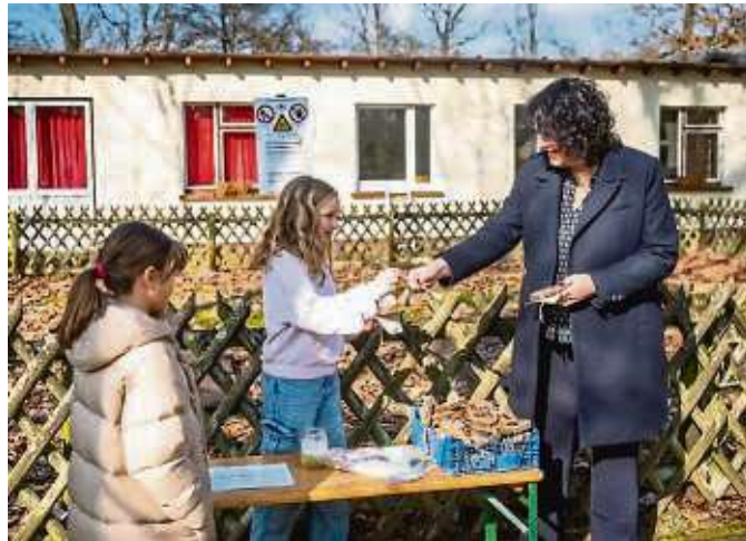
Schülerinnen zeigen Bildungsdezernentin Sylvia Weber das Experiment zur Wasserleitung im Baum.

Als Ergänzung zum schulischen Unterricht bietet „Entdecken, Forschen und Lernen“ Kindern und Jugendlichen vielfältige Möglichkeiten, Lernerfahrungen draußen zu sammeln. „Der Bildungsraum ist ein ausgezeichnetes Beispiel gelebter nachhaltiger Entwicklung“, hebt Sylvia Weber die Bedeutung des Angebots für Kindergarten und Schule hervor. Mit dem Programm wird die Landschaft zu einem grünen Klassenzimmer: Es entsteht Raum für Lernerlebnisse