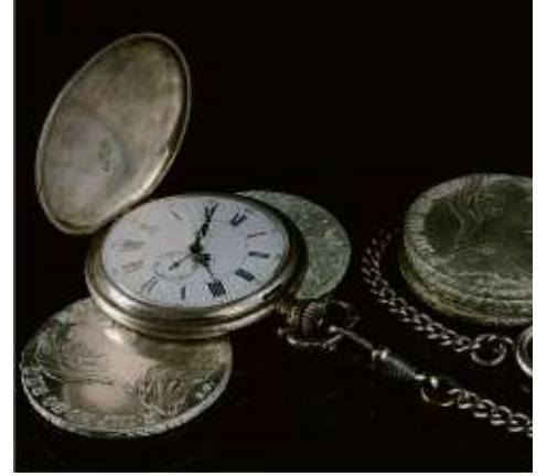
Taschenuhr und Silbermünzen

Berliner Straße 66 (am Theatertunnel) 60311 Frankfurt Innenstadt Tel. 01578 5072282