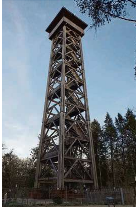
Wer den Goetheturm erklimmen will, muss sich noch bis Mai gedulden.

cher hat jedoch oberste Priorität. Daher ist es unumgänglich, die Wartungsarbeiten vor der Wiedereröffnung des Turms vorzunehmen“, heißt es in einer Pressemitteilung der Stadt. Sobald der genaue Termin für die Wiedereröffnung des Frankfurter Wahrzeichens feststeht, wird das Grünflächenamt Frankfurt diesen zeitnah bekannt geben.