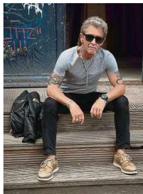
Die Rock-Legende kommt open Air nach Frankfurt: Peter Maffay.

amerikanischen Sängerin Anastacia, die mit „I'm outta Love“ im Jahr 2000 bekannt wurde. Halt macht die singende Ikone auch in Frankfurt: Am Donnerstag, 18. Juli, ab 20 Uhr im Deutsche Bank Park, Mörfelder Landstraße 362. Tickets zu ab 74,95 Euro gibt es online auf eventim.de und an den bekannten Vorverkaufsstellen.