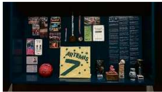
Blick in die Vitrine des Vereins Artemis Sport Frankfurt im Historischen Museum.

2000 Sportlerinnen und Sportlern in Frankfurt ausgerichtet wurden. Artemis Sport Frankfurt ist eine wichtige Anlaufstelle für Frauen und Lesben. Der Verein ist international in LGBTIQ*-Sportverbänden engagiert und auf internationalen Sportturnieren vertreten. In Frankfurt ist der Verein mit politisch-kulturellen Veranstaltungen und der Teilnahme an der Christopher Street Day-Demonstration aktiv. Dass Frankfurt im Vergleich zu anderen europäischen Städten eine immer von Bürgerinnen und Bürgern regierte Stadt war, gehört zu ihren besonderen Eigenschaften. Dieser Einzigartig-