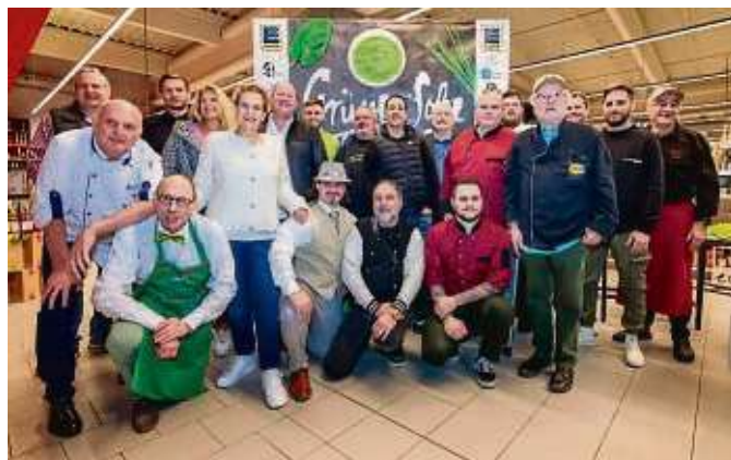
Das Team ums Grüne Soße Festival freut sich schon...