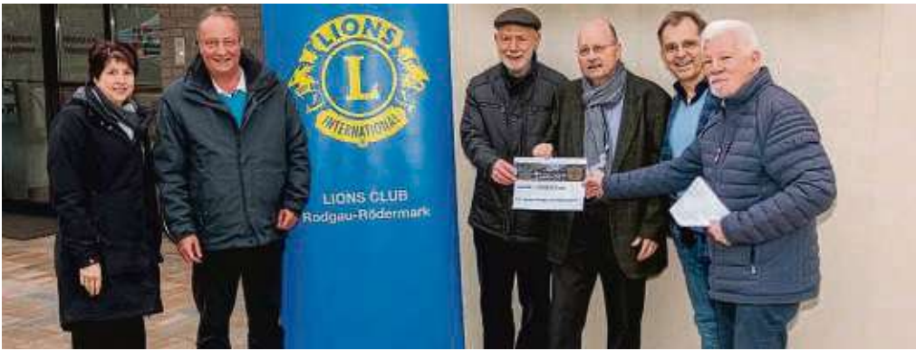
Mit 5.000 Euro ging die größte Spende an das Hospiz in Jügesheim.