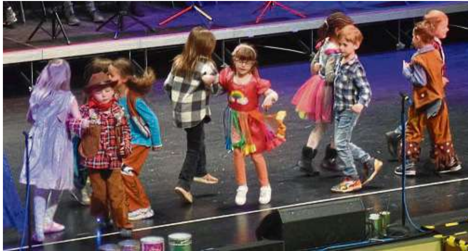
Auf seiner Reise mit der Zeitmaschine durch die Jahrhunderte landete Ritter Rost auch bei den Cowboys.