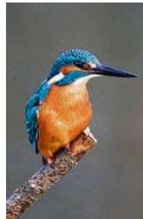
Den Eisvogel kann man an der Rodau oft beobachten. Das Foto zeigt ein männliches Exemplar.

Eine achtköpfige Arbeitsgruppe beschäftigt sich mit dem Finkensee. Die Naturschützer beobachten dort Vögel und andere Tiere, beantworten Fragen von Spaziergängern und stehen in Kontakt mit Behörden. Einer von ihnen steigt mehrmals im Jahr mit der Wathose ins Wasser und holt Abfälle heraus. Im vergangenen Jahr waren die Ehrenamtlichen von Februar bis September unterwegs, um die Pflanzen- und Tierarten in dem Gebiet zu kartieren. Dabei identifizierten sie 179 Arten: Vögel, Fische, Amphibien, Insekten und eine reiche Pflanzenwelt. Die Ergebnisse legten sie anschließend der Stadt Rodgau und der Unteren Naturschutzbehörde in Dietzenbach vor. Nach einer Begehung mit der Stadt wurden erste Nisthilfen aufgehängt, unter anderem für Fledermäuse und Baumläufer. „Sie werden in der Regel schnell angenommen“, weiß Nabu-Mitglied Andreas Pulwey. Die Arbeitsgruppe regt ein ganzes Bündel an Maßnahmen an. Dazu zählen eingezäunte Flächen für Bodenbrüter und eine künstlich aufgeschütete