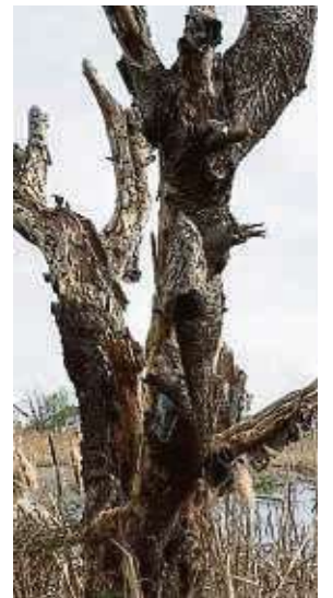
Abgestorbene Bäume sind ein Teil des Lebensraums im ausgedehnten Feuchtgebiet am Finkensee.

te Böschung, in der Eisvögel ihre Bruthöhlen bauen können. Ein weiteres Anliegen ist, die Lücke im Landschaftsschutzgebiet zu schließen.