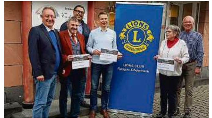
Drei regionale Tafeln freuten sich über die Unterstützung.