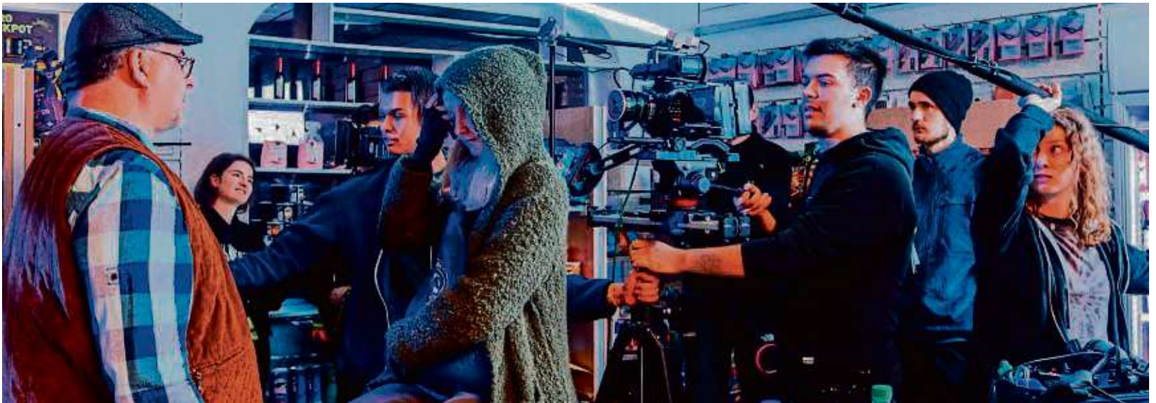
In einem Ober-Röder Kiosk drehten die Rödermarkfreunde ein kurzes Imagevideo, das die Stadt als Kulturspot präsentiert.