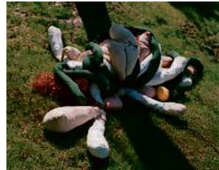
Janaina Tschäpe, „Ovalaria“ SOS-Edition 2011, Auflage: 20+3, nummeriert und signiert, Digitaler c-print, 40,8 x 33 cm

Mit dem Kauf eines limitierten Kunstwerks auf www.sos-edition.de unterstützen Sie Projekte der SOS-Kinderdörfer weltweit.