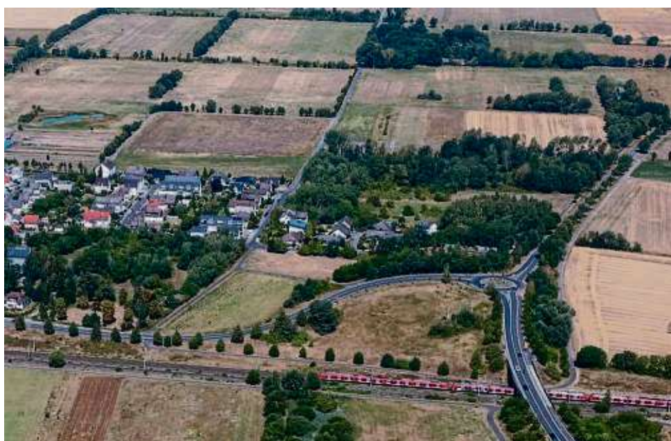
Die Fläche am oberen Bildrand rechts soll zum Solarpark gehören.