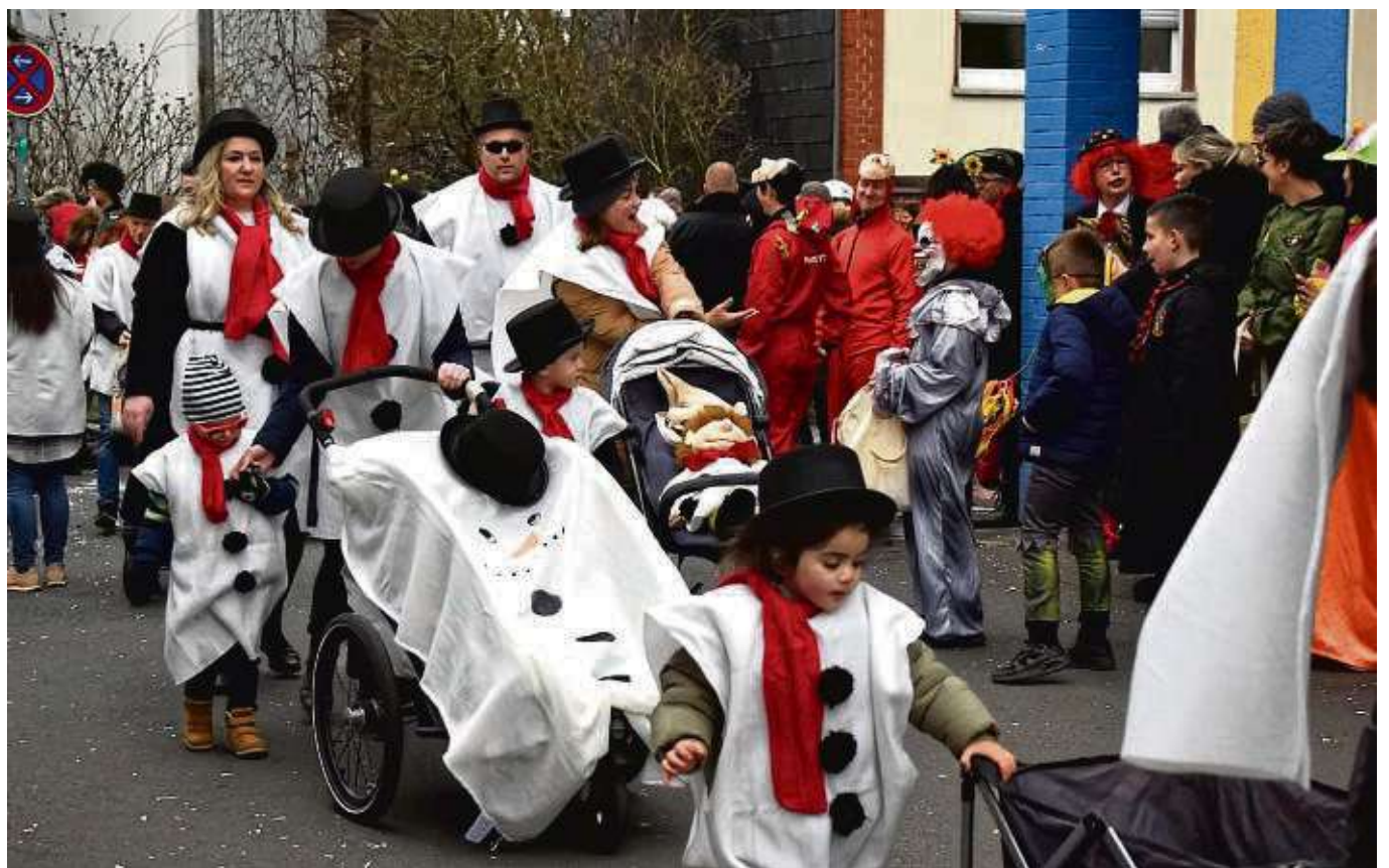
Am Fastnachtssamstag stürmen die Narren traditionell das Ober-Röder Rathaus. Die vielen Kleingruppen mit Kindern machen den Reiz des Zuges aus.

Kappenabend der Gymnastikfrauen, Clubheim FC Germania Ober-Roden, Frankfurter