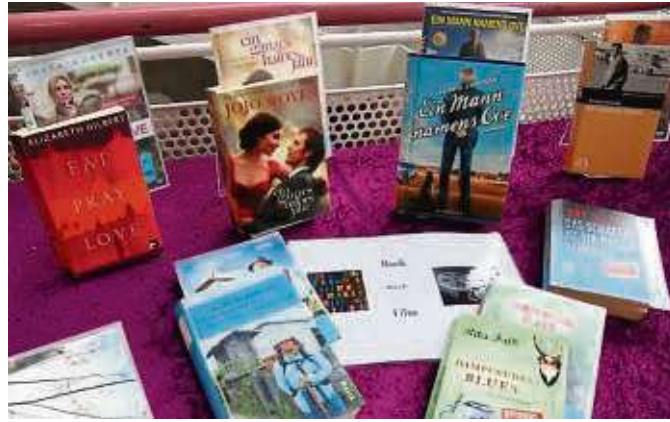
Erst Lesen und dann schauen oder doch andersherum? Das überlässt das Team der Stadtbücherei jedem selbst.

Die Sondertische mit ihren wechselnden thematischen Schwerpunkten sollen Lust auf Lektüre sowie Seh- und Hörvergnügen machen. In der zweiten Hälfte des vorigen Jahres wurde beispielsweise an den „Vater“ von Räuber Hotzenplotz erinnert, den Schriftsteller Otfried Preußler. Dieser hätte im Oktober seinen 100. Geburtstag gefeiert. Außerdem gab es Buchempfehlungen zum Thema „Schicksalsjahr 1923“ mit den Verwerfungen jener Zeit – Ruhrkrise, Hyperinfla-