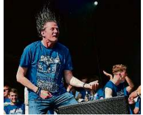
Siegerfoto: Diese Momentaufnahme gelingt dem Rödermärker Sportfotograf Jan Huebner bei der Aufstiegsfeier des SV Darmstadt 98.

Der Beginn ist schwer, denn es gibt „viele Platzhirsche in den Stadien und Hallen“, erinnert sich der gebürtige Großkrotzenburger, der seit 23 Jahren mit Ehefrau in Urberach lebt. Doch sein Durchhaltewillen und „die große Unterstützung durch meine Frau und meine Familie“ helfen. Heute hat der einstige Autodidakt in der Branche einen Namen. Der Profi spult 40.000 Kilometer pro Jahr allein im Auto ab, um die Fußballspiele der Liga eins bis vier abzulichten. Hinzu kommen mit Eintracht