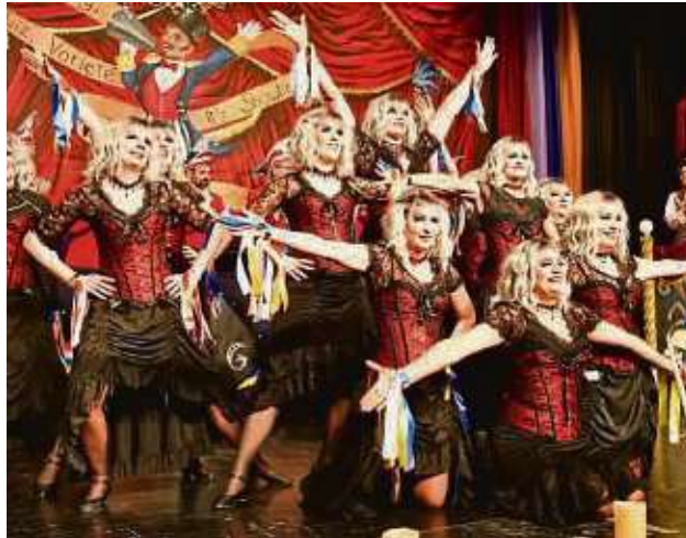
Schaurig schön: „Mothers on Move“ mit ihrem Tanz der Vampirinnen.

Das waren erstaunlicherweise die Setlisten-Punkte, die – wenn solche Sitzungen im Fernsehen übertragen