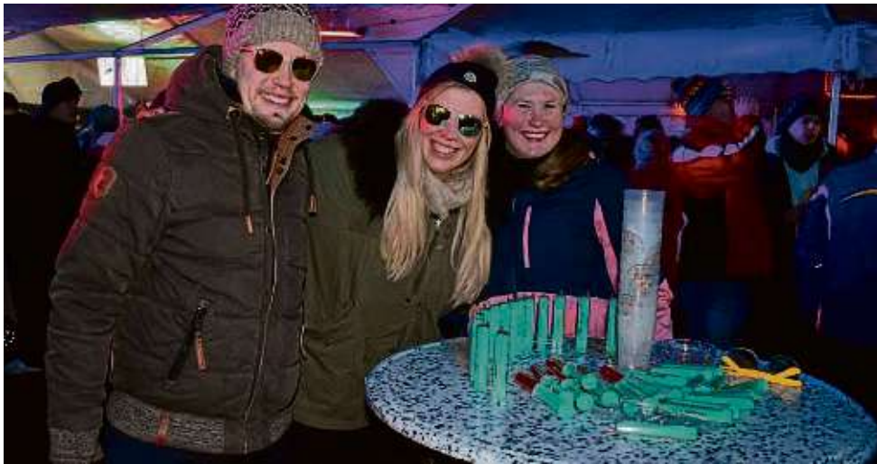
Kein Blut, sondern Erdbeer-Limes: 2500 Spritzen davon waren auch in diesem Jahr wieder sehr gefragt bei der Après-Ski-Party des BSC.