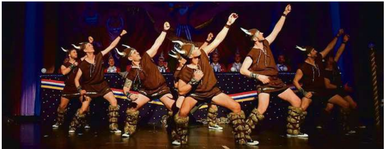
Der Kracher unter den begeisternden Showtänzen: die Männergruppe „Taktlos“ als athletische Wikinger-Horde.

werden – viele Zuschauer vor den Bildschirmen dazu nutzen, um auf Toilette zu gehen oder für Bier-Nachschub zu sorgen.