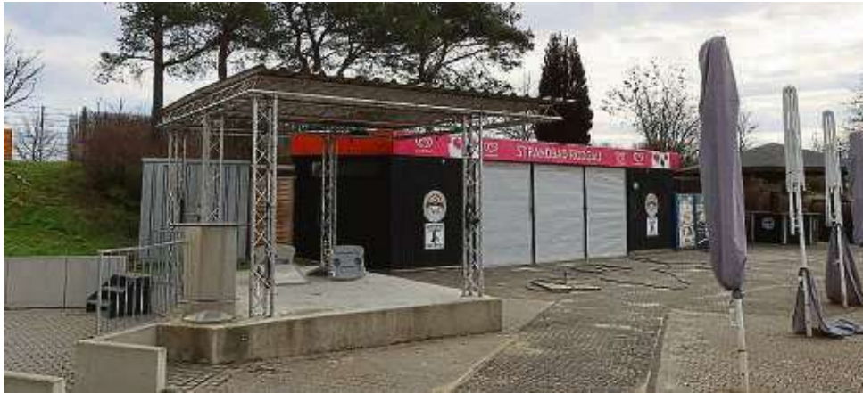
Mehr Platz für Außengastronomie und Bühne sind oberhalb des Textilstrandes geplant.

Nach den Notreparaturen der vergangenen Jahre plant die Stadt nun einen Neubau für die Strandbad-Gastronomie. Bereits beim Bau des Funktionsgebäudes 2020/21 war nach Angaben des Magistrats vorgesehen, „kurz danach einen Neubau für die