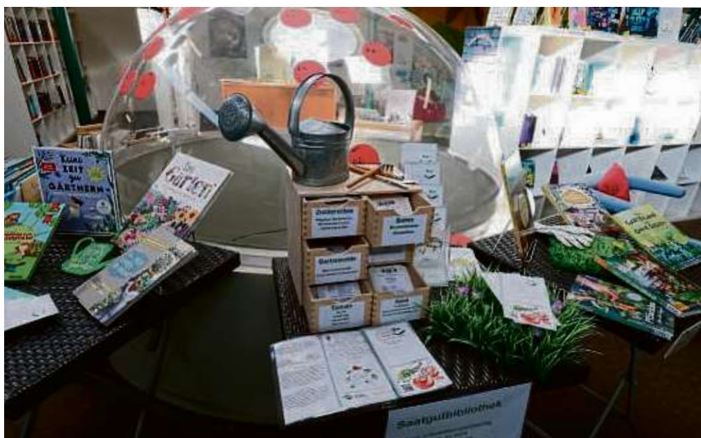
In der Saatgutbibliothek der Stadtbücherei Nieder-Roden kann man sich Samen unter anderem für Salat- und Tomatenpflanzen ausleihen.