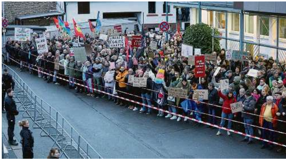
Laut und friedlich demonstrierten rund 1000 Menschen gegen den politischen Aschermittwoch der AfD.