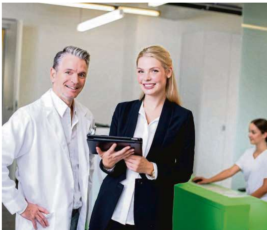
Im Gesundheitswesen ist nicht nur medizinisches Personal, sondern auch kaufmännische Expertinnen und Experten, die organisatorische Aufgaben übernehmen und so den Klinik- oder Praxisalltag am Laufen halten, gefragt.