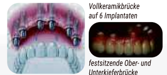
Vollkeramikbrücke auf 6 Implantaten

Festsitzender Zahnersatz im zahnlosen Kiefer