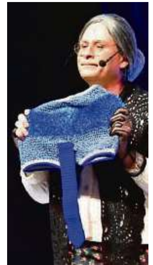
„Fräulein Kokolores“ präsentierte gestrickte Bademoden.

und einige Takte darauf abfahren zu können.