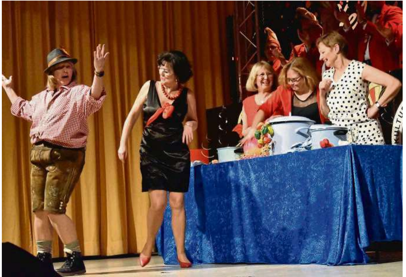
Gymnastikfrauen auf Mönnersuche: Über eine Dating-App organisierten sich die „Belladonnas“ der KSV-Karnevalsabteilung wahre Prachtkerle in Lederhosen oder im Blaumann.