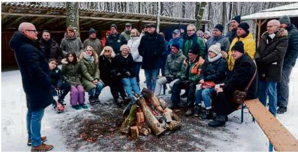
Die Sitzbänke konnten gar nicht nah genug am Feuer stehen: Der traditionelle Neujahrsempfang der Igemo war gut besucht.