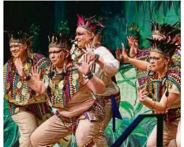
In die Urwälder Südamerikas entführt die Tanzgruppe „Glücksbärchis“ ihr Publikum.

Orchideenblüten und bunte Vögel zieren den Kopfschmuck der Elferfrauen, Palmwedel und Ranken zieren ihre Röcke. Das Dschungel-Motto bietet nicht die Vorlage für eine eindrucksvolle Bühnen-Deko (Yvonne Rebmann), sondern auch Motive für Tänze und andere Vorträge. Das Dschungelcamp darf da nicht fehlen. Lokalkolorit gibt es bei der Ekelprüfung (Kreppel mit Handkäs'-Füllung) und bei der Mutprobe – einer Expedition von der Ortsgrenze Nieder-Rodens in die „verbotene Stadt“ Dudenhofen. Eine Tanzgruppe entführt die Zuschauerinnen in das Reich der Maya und der Inka. Die Kreppelmädels schweben als leuchtende Schmetterlinge durch den Urwald, bevor sie sich verwan-