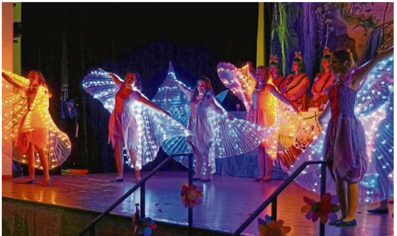
Leuchtende Schmetterlinge: Der Showtanz der „Kreppelmädels“ setzt optische Akzente.

Anzeigenpreis nach Preisliste 63 vom 1. 1. 2024 Falls Sie diese Zeitung nicht mehr erhalten möchten, bitten wir Sie einen Werbeaufkleber mit dem Zusatzhinweis „bitte keine kostenlosen Zeitungen“ an Ihrem Briefkasten anzubringen. Ideal wäre auch ein Hinweis unter Angabe Ihrer Anschrift auf www.stadtpost.de unter dem Reiter Zustellung, damit wir unsere Träger informieren können.