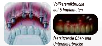
Vollkeramikbrücke auf 6 Implantaten feststehende Ober- und Unterkieferbrücke

Festsitzender Zahnersatz im zahnlosen Kiefer