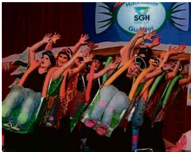
In Schieflage kamen die Gassehopper bei ihrer temporeichen und riskanten Bobfahrt. Wetten, dass die temperamentvolle Gruppe auch den Fastnachtszug aufmischen wird?

Zum Aufwärmen des Publikums hatte sich die SGH Gäste eingeladen: die Gesangsgruppe „Muntermacher 4.0“ vom Lämmerspieler Carnaval-Verein. Die machten ih-