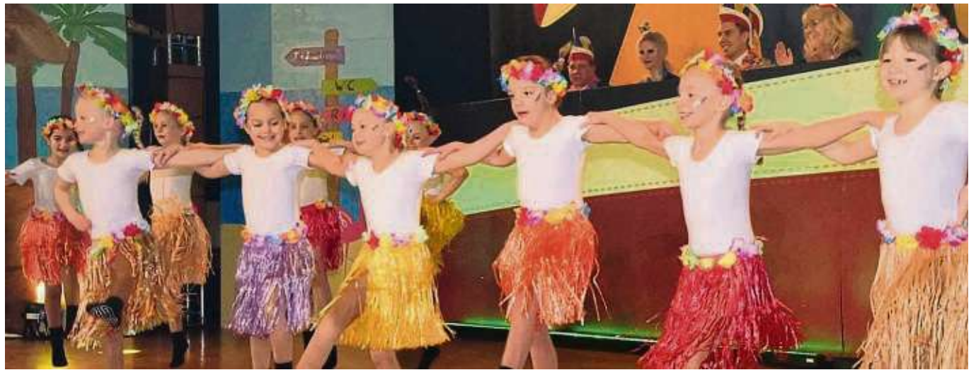
Auch die Kleinsten ernteten bei der Gala-Sitzung der „Elf Babbscher“ großen Applaus. Garde- und Showtänze waren eine Augenweide für die Zuschauer in der Turnhalle der Joseph-von-Eichendorff-Schule.

Unter den drei Sitzungen, die im Umkreis von wenigen Kilometern zeitgleich liefen, kennzeichnet die Babbscher ein Feuerwerk technischer Errun-