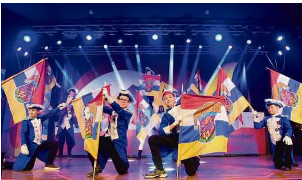
Die Banner-Garde der „Elf Babbscher“ halten nicht nur die Fahnen für ihren Verein hoch, sie begeistern auch immer wieder mit einstudierten Choreografien.