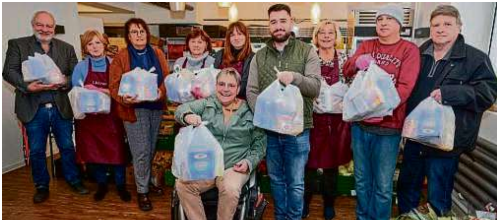
15 Lebensmitteltüten spendete das A&O internationale Frischezentrum zum wiederholten Mal dem „Lädchen“, der Lebensmittelausgabe im Sozialzentrum an der Friedensstraße.