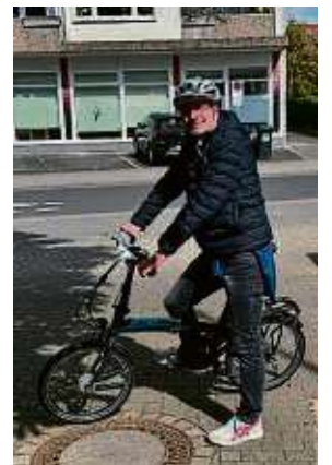
Besser oben mit: Der Reporter auf Dienstfahrt. Der Helm gibt dann doch mehr Sicherheit.

Fast zwei Stunden Fahrt später das Fazit: Es geht gut mit dem Velo durch Obertshausen, vorausgesetzt, man sieht von nicht blinkenden Abbiegern, ein paar eiligen Sportsfreunden mit getönten Scheiben und einem übermotivierten E-Autofahrer ab.