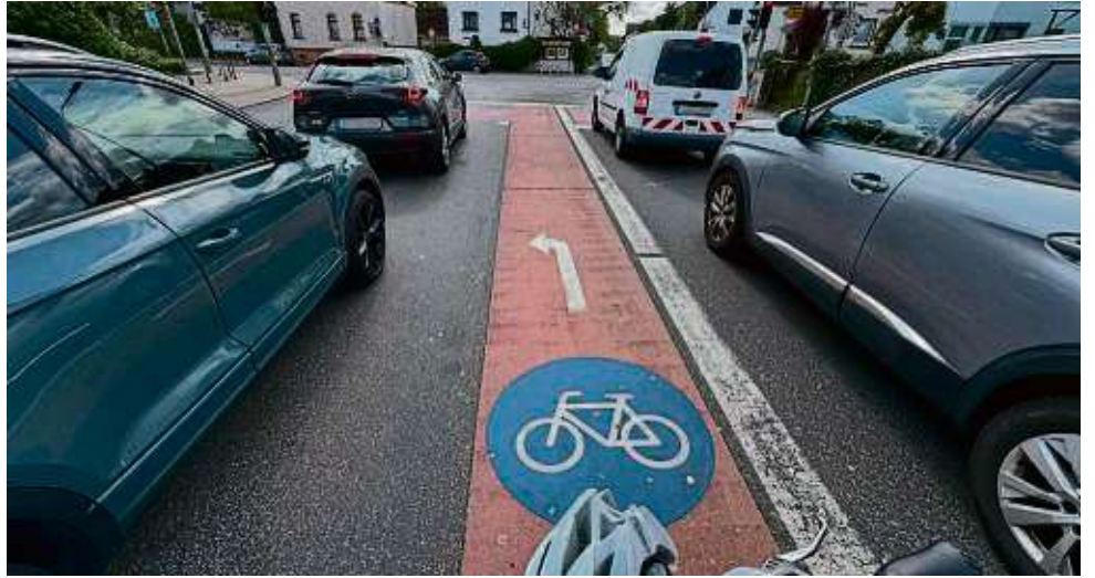
Engstelle: Von der Leipziger Straße kommend braucht der Radler Richtung Schönbornstraße (links) Selbstbewusstsein. Auch, wenn ihm die eigene Spur Sicherheit geben sollte.

Das ist aber auch schon der nervigste Moment eines Vormittags per Fahrrad durch Obertshausen. Vielleicht lag es an der Uhrzeit, vielleicht am schönen Wetter, vielleicht an den Ferien: Es war eine weitgehend stressfreie Fahrt. Gut, die tellerflache Topografie der Stadt ermöglicht sowieso entspanntes Rollen, und jenseits der