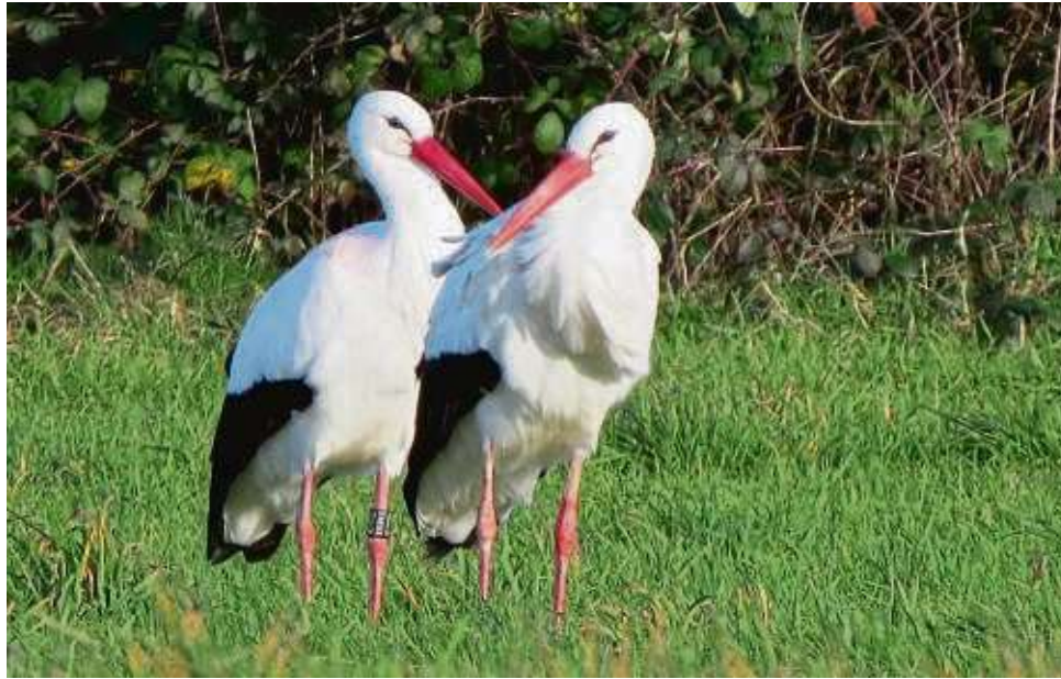
Mit dem Code 9X810 ist der Storch versehen, der gemeinsam mit einem Artgenossen bei Obertshausen überwintert, statt in den Süden zu fliegen.

Obertshausen – So mancher Spaziergänger und manche Spaziergängerin werden sich die Augen reiben: Seit Dezember sind regelmäßig auf den Wiesen in der Rodauniederung zwei Weißstörche zu beobachten. Das teilt der Naturschutzbund (Nabu) Obertshausen mit. Die Vögel haben demnach die Weihnachtstage und den Jahreswechsel im Stadtteil Hausen verbracht. Zumeist sind die beiden „Adebars“ auf derselben Wiese zu sehen, auf der sich nach den Regenfällen größere Wasserflächen gebildet hatten. Hier fänden die beiden Tiere genügend Nahrung, wie Regenwürmer, die in der nassen Erde zur Oberfläche kommen. Bei den beiden Störchen handele es sich jedoch nicht um das Brutpaar vom Wiesenhof, schreibt der Nabu. Ein Vogel trage einen Ring mit dem Code 9X810. Der sei „ein alter Bekannter“ und brüte seit mehreren Jahren nicht weit entfernt nahe der Kläranlage bei Rodgau-Weiskichen. Beringt wurde er im Mai 2011 im Vogelpark