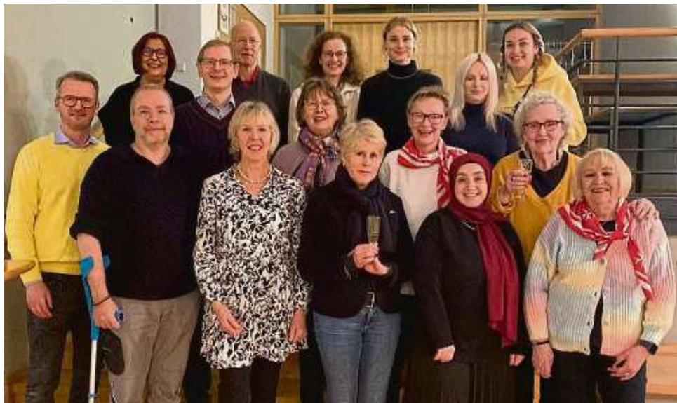
Ein gewachsenes Team, auch wenn auf dem Bild einige fehlen. Als die Malteserpraxis vor fünf Jahren ihre Arbeit aufnahm, bestand sie aus drei Ärzten und sechs Helfern – heute teilen sich 21 Leute die Dienste untereinander auf.