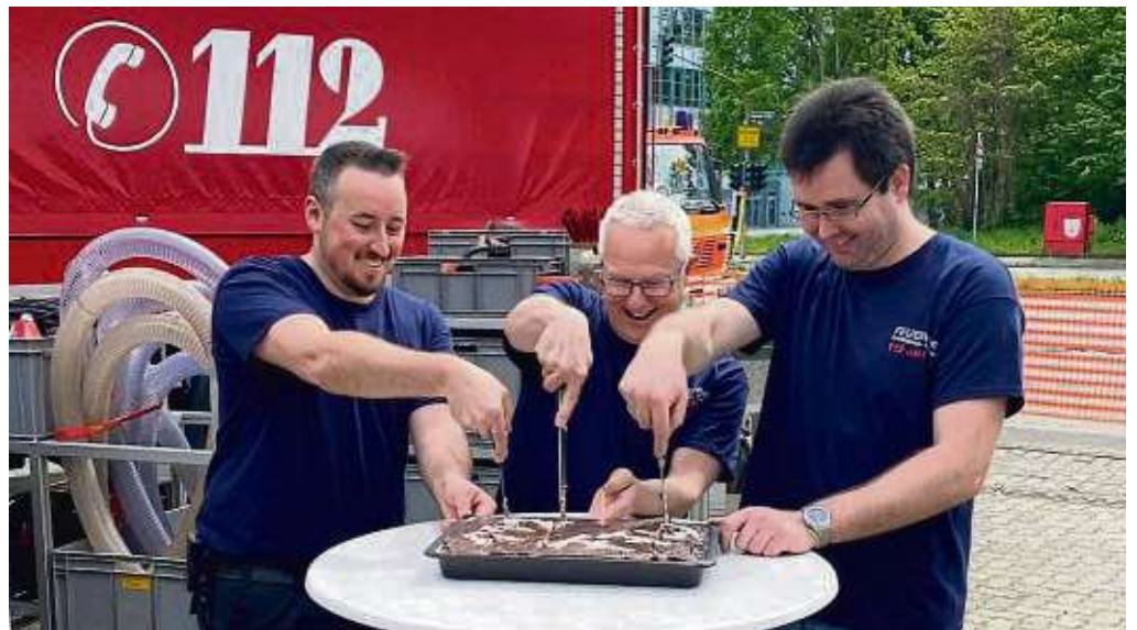
Vorfriede auf Leckerem beim Familientag der Freiwilligen Feuerwehr Waldheim.