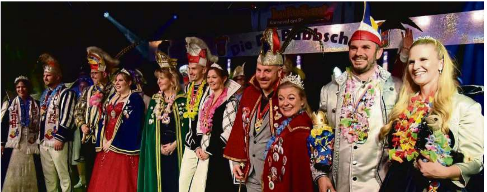
Feiern gemeinsam die Babscher: Alle Tollitäten auf der Bühne.