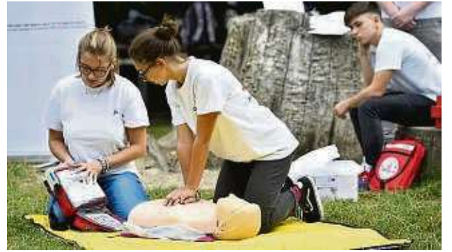
Nachwuchshelfer trainieren für den Ernstfall: Auch wer sich zunächst beim Jugend-Rotkreuz engagiert, ist versiert in Erster-Hilfe.

Weiter betreut der Ortsverein das Kreisaukunftsbüro Hausen, das zum Suchdienst des DRK gehört. In der Geschäftsstelle in der Friedensstraße 26 ist auch der Hausnotrufdienst beheimatet sowie das Sozialkaufhaus mit Kleiderkammer und Lebensmittelausgabe „Lädchen“, wo das DRK Hausen einer der fünf Kooperationspartner ist. „Das