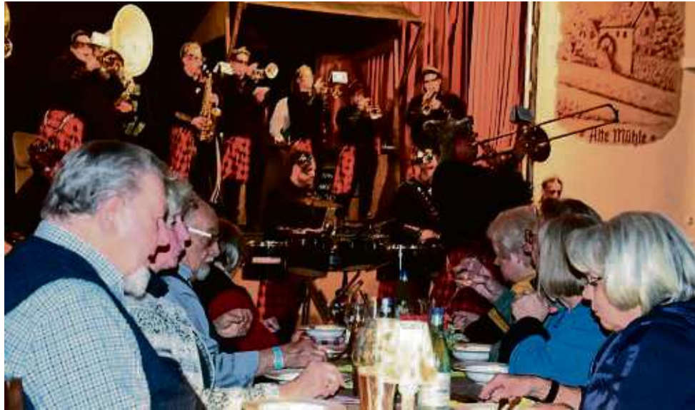
Zur Guggenmusik ließen sich die Besucher der Neujahrsrevue in der Roten Warte ein Fünf-Gänge-Menü schmecken.