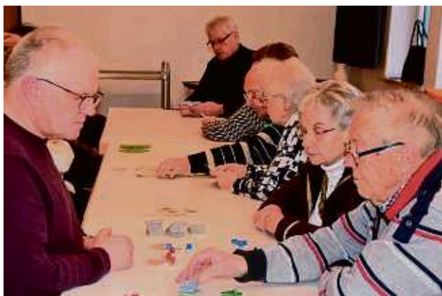
Mit Spielen startete die Kolpingfamilie Hausen ins neue Jahr. 2024 blickt man auf 70 Jahre Bestehen zurück.