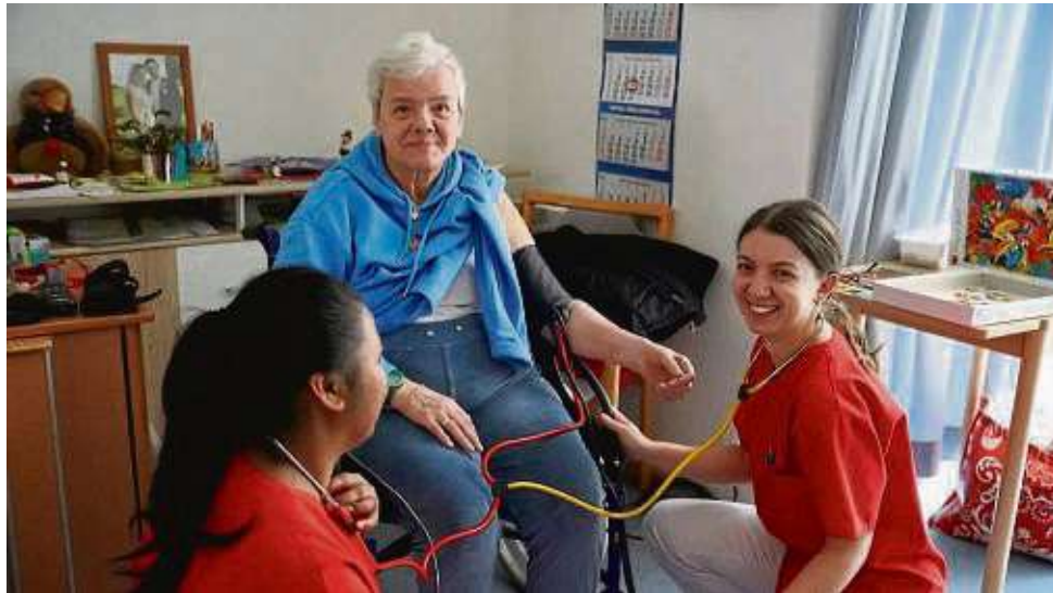
Pflegeschülerinnen messen einer Bewohnerin den Blutdruck mit einem speziellen Schulungsgerät.

„Die Sicherheit der Bewohner war jederzeit gewährleistet“, betont Como. Sie hat das Schulstation-Projekt ange-regt – eine Premiere im Caritaszentrum – und das Konzept mit den Anleiterinnen und Azubis ausgearbeitet. Die Koordinatorin selbst schaute jeden Tag nach dem Rechten. Ziel war, dem Nachwuchs einen ganzheitlichen Blick auf das Zusammenspiel der pflegerischen Abläufe zu ermöglichen, als es der normale Ausbildungsbetrieb zulässt. „Besonders die planerischen, organisatorischen Tätigkeiten konnten wir auf der Schulstation hervorragend praktisch trainieren. Dazu gehört das Erstellen der Dienstpläne, die Abstimmung im Team und die Zusammenarbeit mit weiteren Berufsgruppen, die im Heim