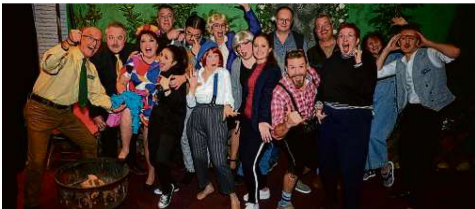
Mit großem Spaß soziale Projekt unterstützen, das ist Antrieb des Theaterclubs Lachmal, der fast 10.000 Euro an Spenden an verschiedene Initiativen übergeben konnte.