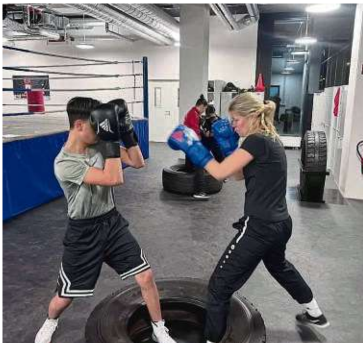
Deckung halten: Die Mitglieder des Boxclubs Nordend können in den neuen Räumlichkeiten an der Hafenallee trainieren.

ROCKYWOOD Boxclub Nordend hat neue Räumlichkeiten bezogen