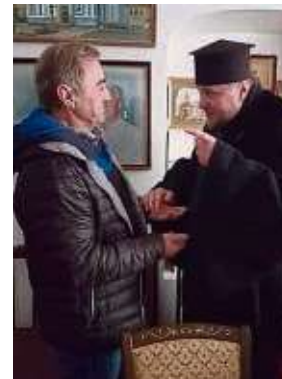
Treffen mit Bischof Matvey: „Ein weiser Mann“.