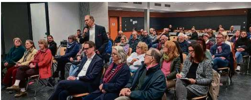
Ordentlich gefüllt war die Cafeteria von Ludwig-Dern- und Lauterbornschule beim OB-Orts-termin.