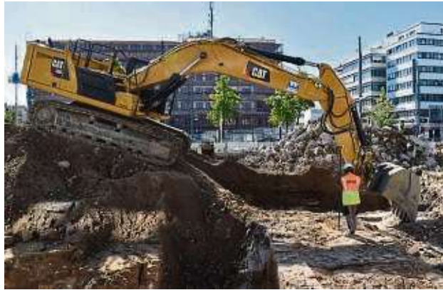
Im Herbst 2022 wurde dieses Gelände an der Berliner Straße untersucht.

Vor Grabungsbeginn herrschte die Hoffnung, etwas vom (spät-) mittelalterlichen Kern Offenbachs zu entdecken, doch dies bestätigte sich nicht. Die Funde im Boden sind in die Neuzeit zu datieren. „Das Gelände wurde schon früher bebaut, wenn es mittelalterliche Reste gab, wurden die damals zerstört“, berichtet Müller. Die freigelegten Fundamente sind aufs 19. Jahrhundert zu datieren, die Archäologen haben die ehe-