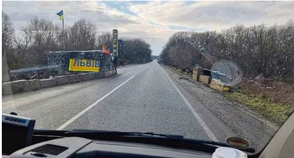
Straßensperren sind keine Seltenheit: Auch auf dieser Bundesstraße in Richtung Liew im Westen der Ukraine müssen solche Posten passiert werden.

Seit Fronleichnam 2022 fährt der Obertshausener regelmäßig in diese Region. Damals startete er seinen ersten privaten Transport mit Hilfsgütern für Menschen in dem Land, das genau vor zwei Jahren von Russland überfallen wurde. Unter dem Dach der Hobby-Fußballmannschaft FC