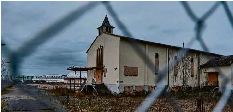
Diese Kapelle auf dem Google-Areal steht unter Denkmalschutz.

Im Dezember 2020 hatte das Unternehmen das Grundstück mit der denkmalgeschützten Kapelle darauf erworben, zeitgleich mit einer Fläche in Dietzenbach. Damals nannte Google noch keinen Zeitplan für die Gestaltung des Erlenseer Areals. Laut Bürgermeister Stefan Erb soll dort nun voraussichtlich zunächst ein kleines Rechenzentrum entstehen. Der Hard- und Software-Gigant will aber auch dies auf eine Anfrage unserer Zeitung hin nicht bestäti-