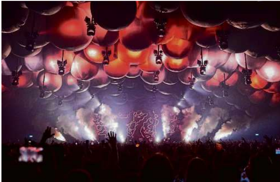
Die Time Warp verbindet visuelle Effekte mit dem Nonplusultra der elektronischen Musik – und das seit 30 Jahren.