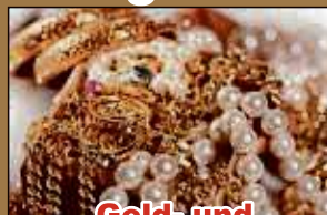
Gold- und Silberschmuck