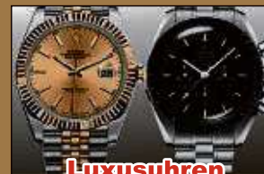
Luxusuhren aller Art