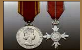
Medaillen / Orden