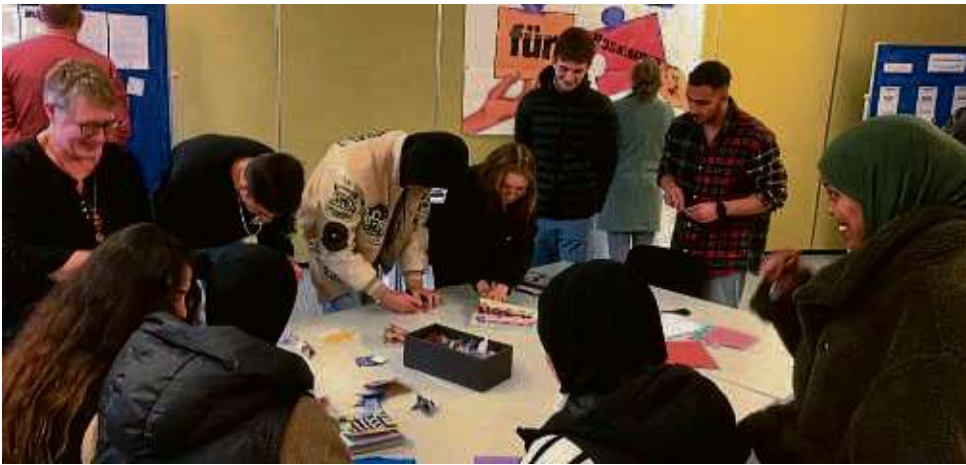
Jugendliche der Ludwig-Geißler-Schule haben anlässlich des Jahrestages des Hanau-Attentats Friedenssymbole gestaltet und sich intensiv mit der Frage auseinandergesetzt, wie ein friedliches Miteinander vonstattengehen kann.