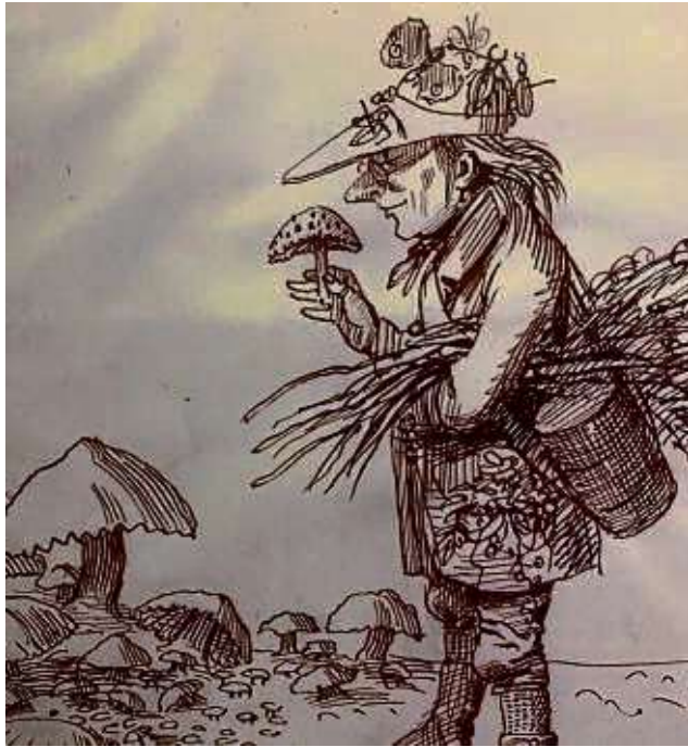
Die Zeichnung des „Pilzforschers“ stammt vom „Malerbruder“ Ludwig Emil Grimm.

waren Karikaturen der Verwandtschaft und skurriler Begebenheiten. In der großen Grimm-Sammlung des Historischen Museums Schloss Philippsruhe findet sich etwa die Zeichnung eines „Pilzforschers“. Mit feinen Federstrichen lässt Grimm das mit einer Botanisiertrommel ausgestattete Männlein einen Fliegenpilz begutachten. Auf seinem Hut sind Schmetterlinge und (Hirsch-)Käfer aufgespießt. Als Untertitel notierte der Künstler: „In die Wunderwerke der Natur versunkener Forscher, den 8. Februar 1853 Fastnachts“. Grimm zu Ehren wird seit 2012 der Ludwig-Emil-Grimm-Preis für Karikatur der Stadt Hanau vergeben. Auch erinnert ein Bronzedenkmal vor dem „Hotel zum Riesen“ am Heumarkt an den Maler, Radierer und Kupferstecher, der dort 1819 Gast des Silvesterballs war, wie er in seinen Lebenserinnerungen schreibt.