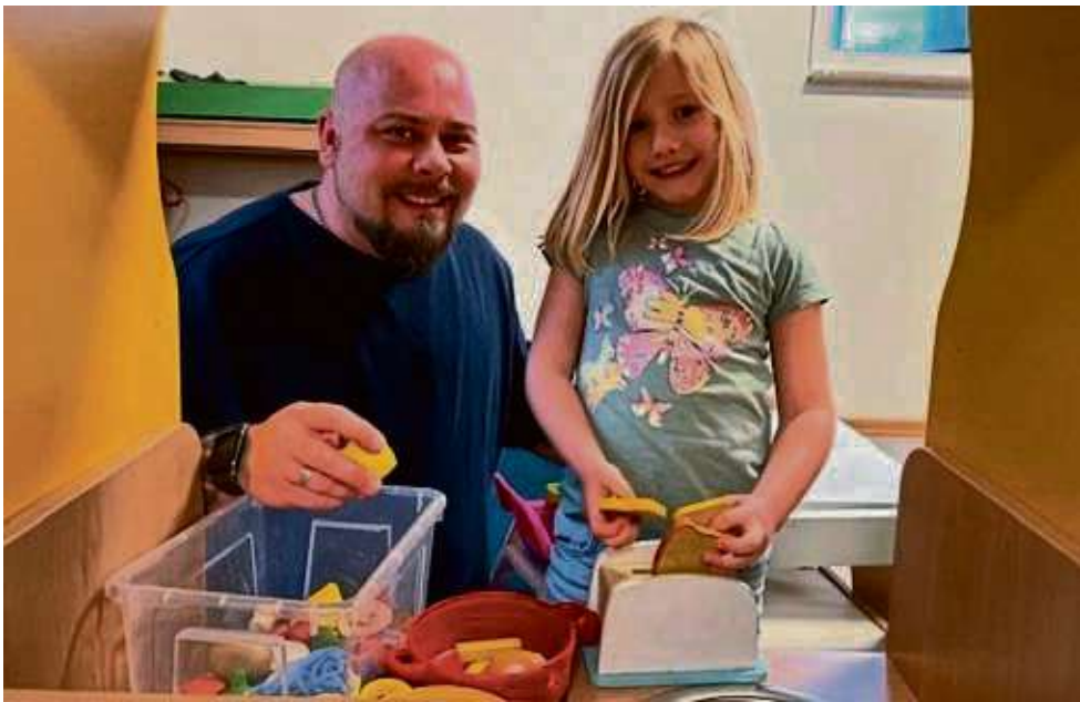
Spannende Einblicke gewähren die Erlenseer Kitas am 25. April.