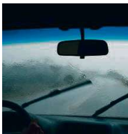
Damit man stets einen klaren Durchblick hat, sollte man auf das richtige Scheibenwischwasser achten.

zehn Grad. Experten raten zu einem Frostschutz von bis zu minus 20 Grad. Bei Fertigmischungen kann man jene wählen, die den gewünschten Frostschutzwert aufweist und diese direkt in die Wischanlage füllen. lps/AM.