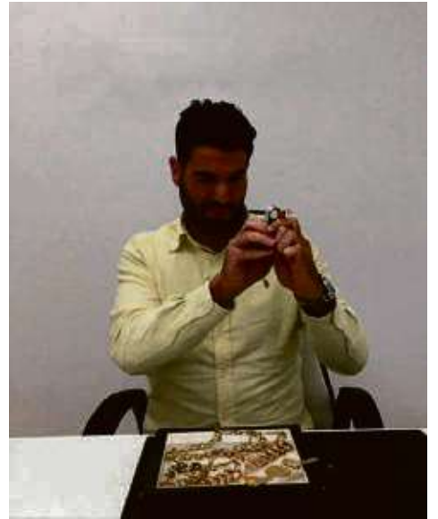
Ihr Spezialist für Goldankauf.