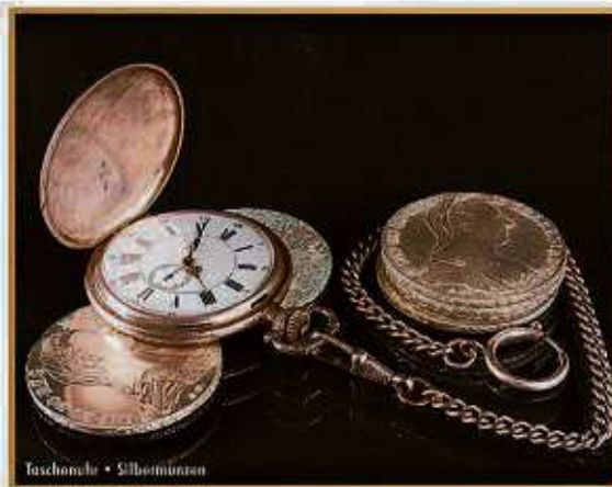
Faschonuhr • Silbermünzen

aus dem Tresor zu holen und diese den Experten vorzulegen. Laut Experten kann beispielsweise eine Rolex GMT Master aus den 70er Jahren bis zu 9.000 EUR erzielen. Des Weiteren bieten die Experten von »Bares für Wa(h)res« kostenlose Wertschätzung von Diamanten an. Besonders interessant sind Diamanten im Brillant-Schliff ab einer Größe von 0,50 Carat. Hier gilt immer die Faustregel: ein einzelner großer Diamant ist wertvoller als viele kleine Diamanten. Ein Besuch bei den Experten lohnt sich in jedem Fall, denn hier wird Ihr Schatz professionell taxiert und zu einem fairen Preis entgegengenommen.