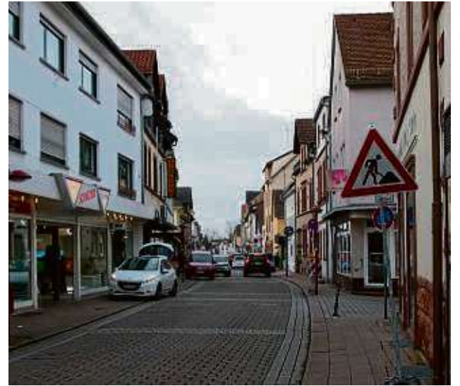
Nach Meinung der Grünen im Ortsbeirat Großauheim hat die dortige Hauptstraße in den vergangenen Jahren an Attraktivität verloren.

Mit einem deckungsgleichen Antrag bitten CDU und Grüne den Magistrat, 500 000 Euro für „die Erstellung eines Entwicklungskonzepts und Umsetzung erster Maßnahmen zur nachhaltigen Aufwertung des Lindenaubads“ im Haushalt einzuplanen. Die Christdemokraten hoffen zudem auf die Errichtung eines „Sauna- und Wellnessparks auf dem Gelände des Lindenaubades“, der „eine