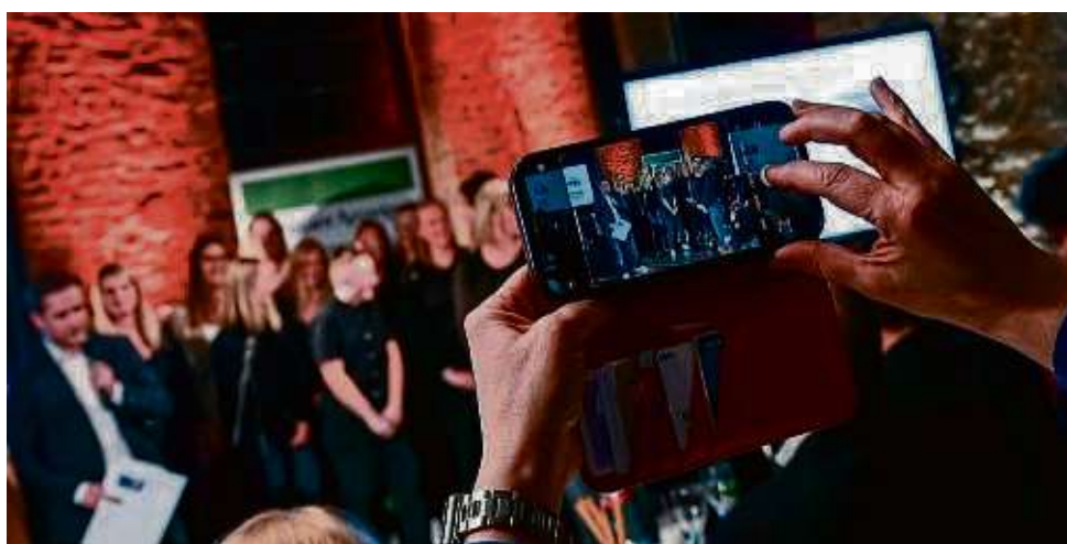
Erinnerungsfotos werden sicher auch diesmal wieder gemacht, wenn die Titel HANAUER Sportlerin, Sportler und Mannschaft des Jahres vergeben werden.