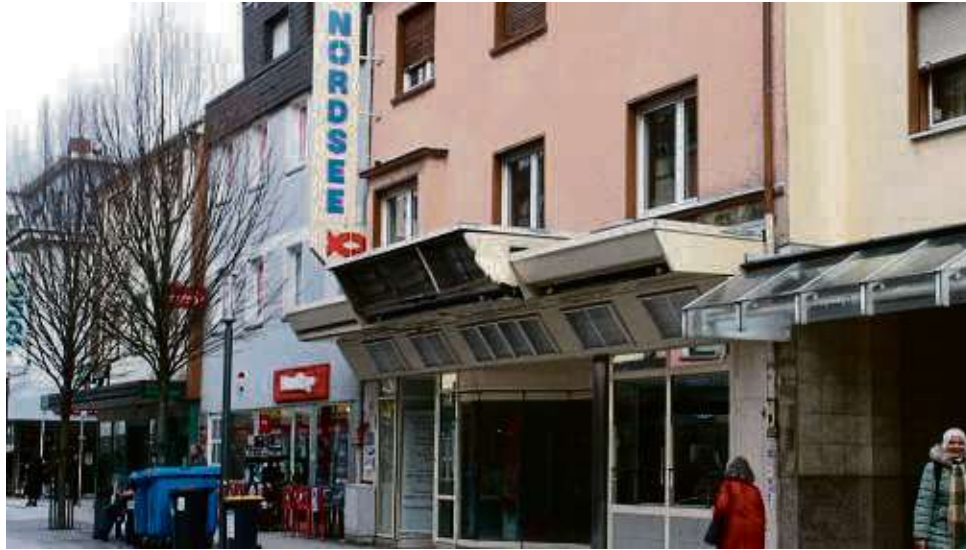
40 Jahre lang war das Geschäft Teil des Stadtlebens, kürzlich wurde es endgültig geschlossen.

Die Stadt Hanau beziehungsweise deren Marketing-