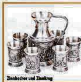
Zinnhohler und Zinnkrug