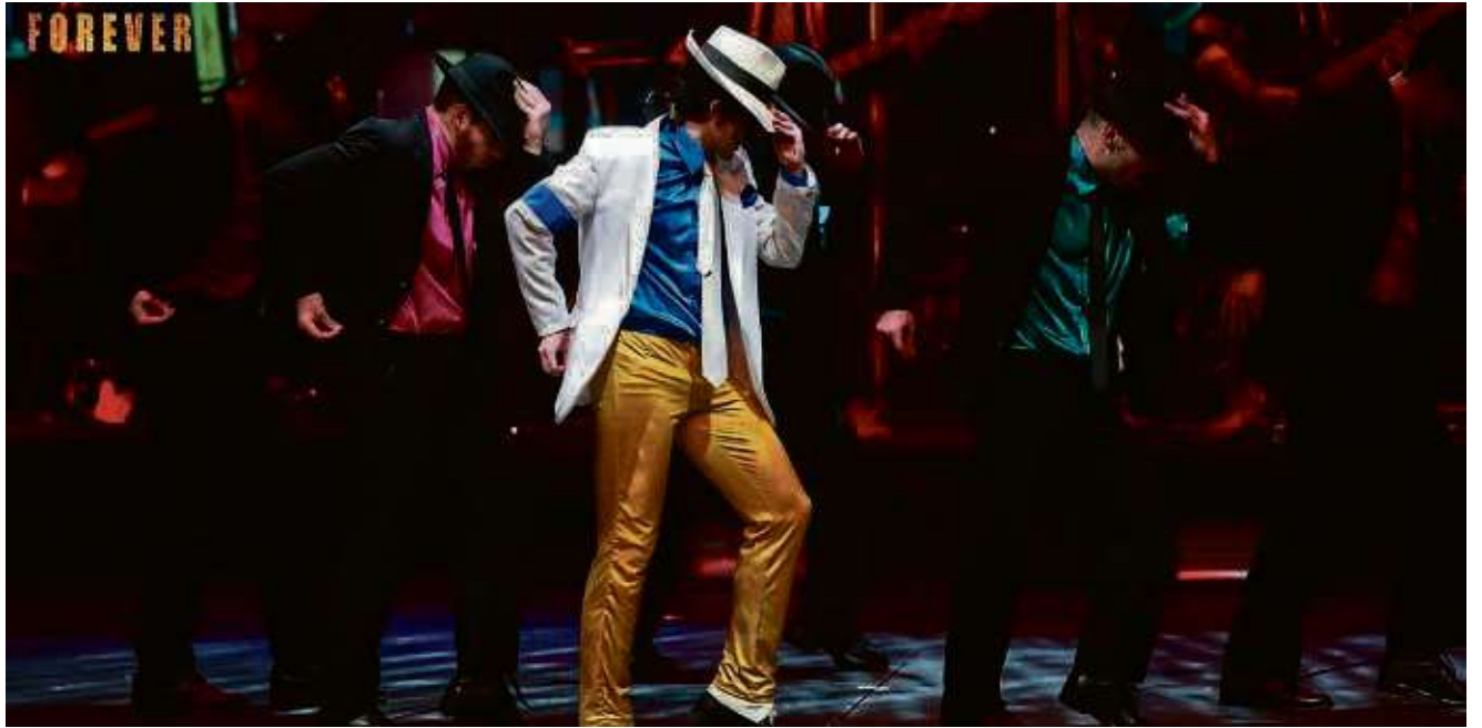
Der King of Pop steht im Mittelpunkt des Tribute-Konzerts in der Alten Oper Frankfurt.