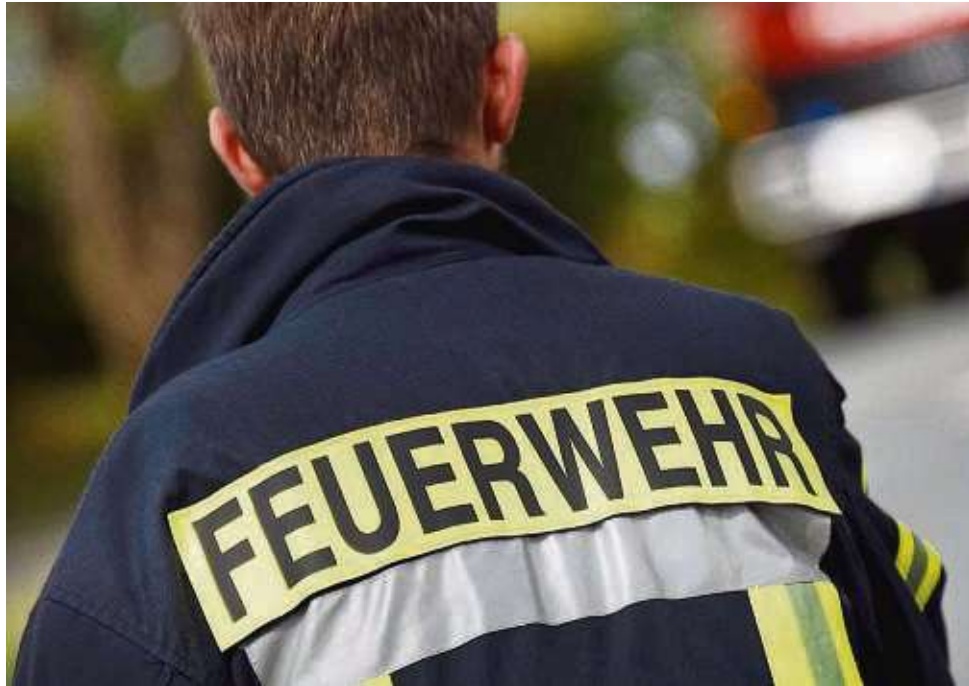
Nicht nur hervorragende Sportler , sondern alle Personen aus der Bevölkerung, die sich ehrenamtlich engagieren, sollen künftig in Erlensee gewürdigt werden.

Um ehrenamtlich Tätige in allen Bereichen in der Öffent-