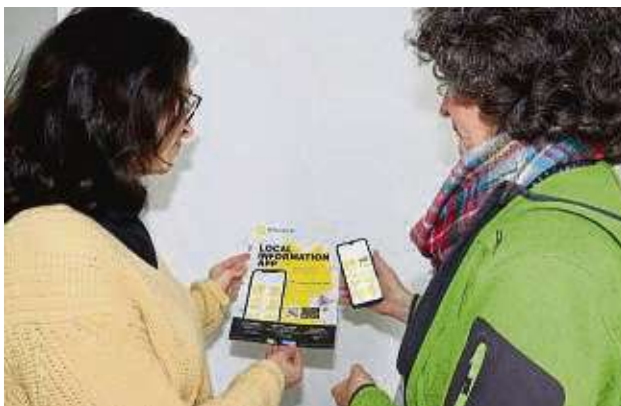
„Integreat-App“ feiert ersten Geburtstag.

Ausgangspunkt der mehrsprachigen digitalen Informationsplattform war der Wunsch, lokale Auskünfte jederzeit aktuell bereitstellen und verbreiten zu können. Die App wird derzeit von über 100 Städten und Landkreisen eingesetzt.