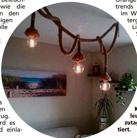
Klassische Hänge-leuchten werden heu-tutage modern interpre-tiert.

renabteilungen der Kauf-häuser können dank der Vielzahl der zur Auswahl ste-henden Artikel die Farbtöne und das Design des Geschirrs aufeinander abgestimmt werden. Blau, Gelb und Orange zählen zu den Farb-trends bei den Sitzmöbeln im Wohnraum oder Win-tergarten. Als einzelne Lieblingsstücke setzen Sessel oder Sofa farb-liche Highlights im Zimmer, ohne dass es überladen wirkt. lps/Jv.