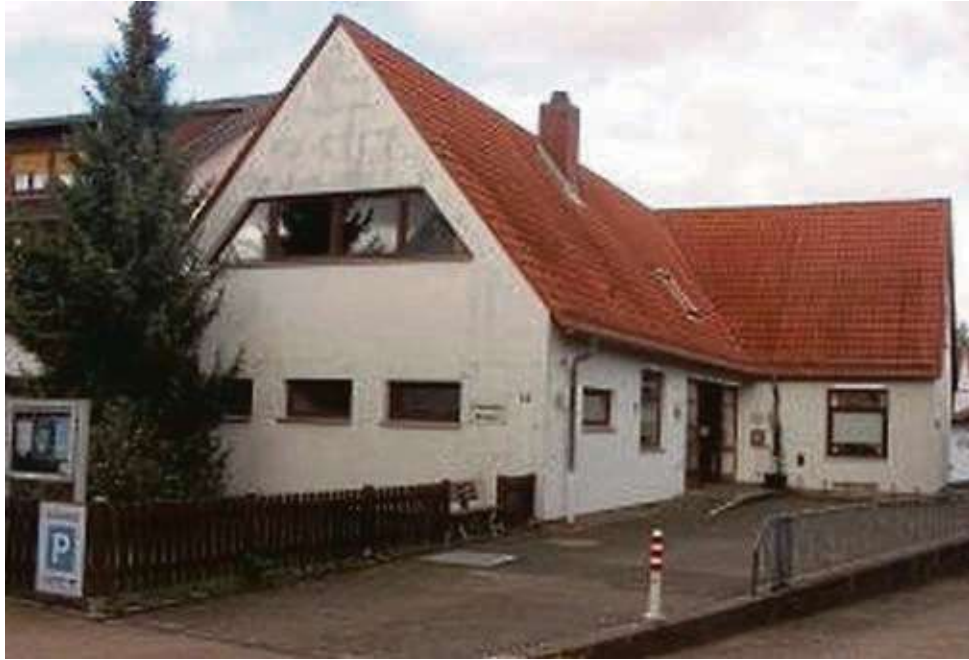
Das evangelische Gemeindehaus in Oberissigheim ist nicht mehr in Betrieb: Zum Jahresende wurde das Gebäude geschlossen. Die Zukunft ist noch ungewiss.