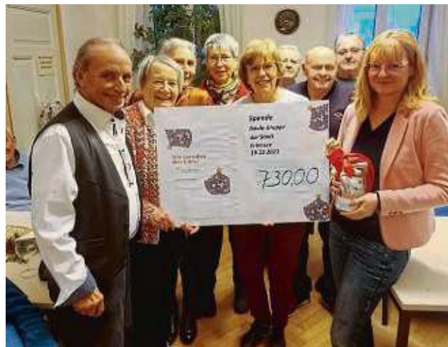
730 Euro nahmen die Mitglieder der Kreativ-Gruppe beim Hobby-Künstlermarkt ein; der Erlös wird gespendet.

Wer nichts kaufte, aber dennoch Geld in die Spendendose steckte, durfte sich ein Glas Gelee oder eine Tüte Weihnachtsplätzchen mitnehmen – beide Leckereien waren natürlich auch selbst gemacht. sam