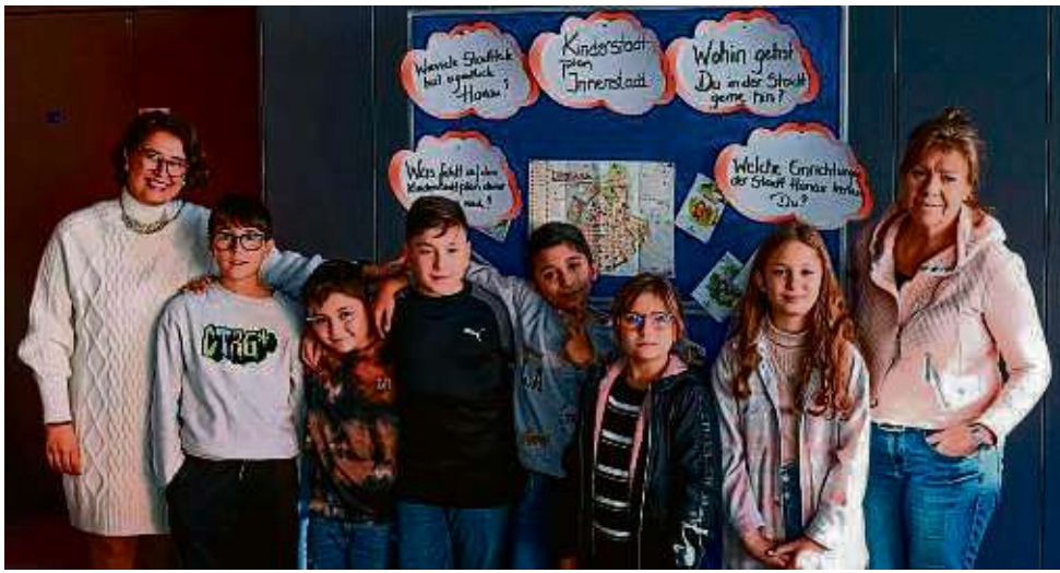
Schülerinnen und Schüler der Brüder-Grimm-Schule brachten einige Vorschläge zum Gespräch im Hanauer Rathaus mit.