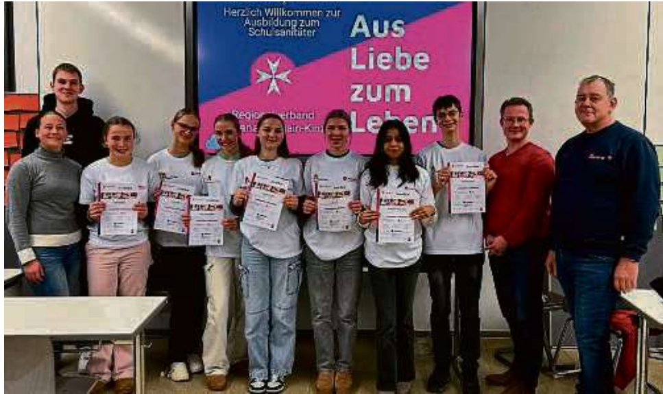
Engagement für die Mitschüler: Der Schulsanitätsdienst der Hola hat sieben neue Mitglieder.

In der Ausbildung lernten die Jugendlichen, sich richtig in Notfallsituationen zu verhalten, lebensrettende Sofortmaßnahmen anzuwenden und den Rettungsdienst korrekt zu alarmieren. Außerdem wurde der Umgang mit speziellen Verletzungen wie zum Beispiel Knochen-