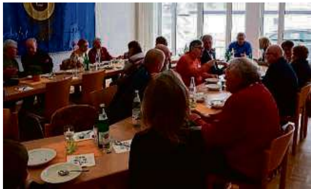
Etwa 30 Gäste fanden sich zur Premiere des Selbolder Projekts „Eintopf“ im Katharina-von-Bora-Haus ein, um den ersten Mittagstisch zu genießen.

Wisseler zeigte sich insbesondere darüber begeistert, dass es von der ersten Idee im