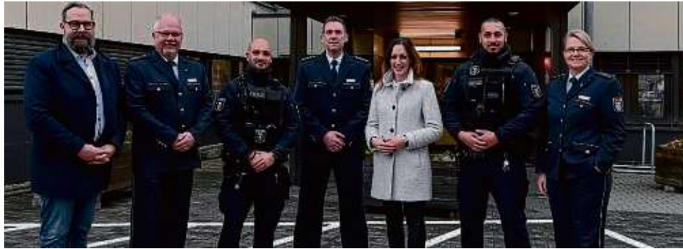
Alle Beteiligten sind sich einig, dass das Projekt zu einem Erfolgsmodell geworden ist.