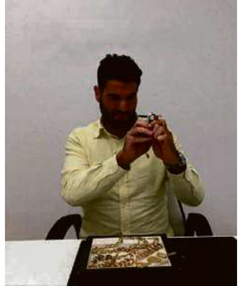
Ihr Spezialist für Goldankauf.