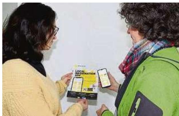
„Integreat-App“ feiert ersten Geburtstag.