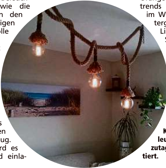
Klassische Hängeleuchten werden heutzutage modern interpretiert.

renabteilungen der Kauf-häuser können dank der Vielzahl der zur Auswahl ste-henden Artikel die Farbtöne und das Design des Geschirrs aufeinander abgestimmt werden. Blau, Gelb und Orange zählen zu den Farb-trends bei den Sitzmöbeln im Wohnraum oder Win-tergarten. Als einzelne Lieblingsstücke setzen Sessel oder Sofa farb-liche Highlights im Zimmer, ohne dass es überladen wirkt.