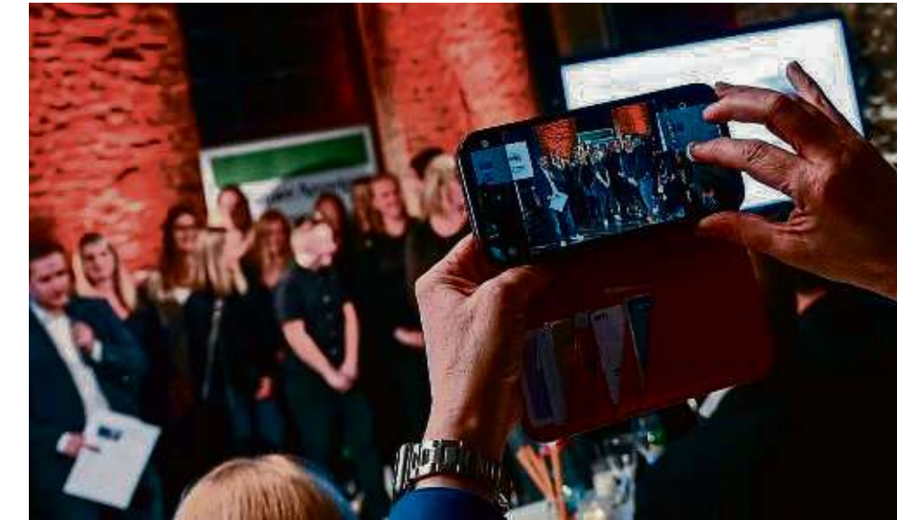
Erinnerungsfotos werden sicher auch diesmal wieder gemacht, wenn die Titel HANAUER Sportlerin, Sportler und Mannschaft des Jahres vergeben werden.

Einerseits erhöht jede Stimme die Chance des bevorzug-