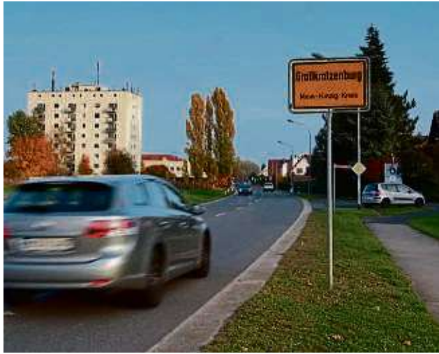
Die Großkrotzenburger wünschen sich mehr Blumen im Ort.

Diesen Antrag, erklärte Max Schad (CDU), gebe es längst nicht zum ersten Mal. „Aber die personelle Situation am Bauhof ist nach wie vor angespannt. Darunter leidet die Pflege von Beeten und Rabatten.“ Gemäß des Dop-