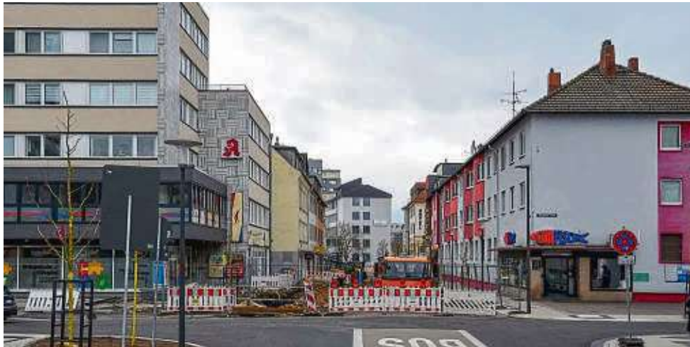
Die Römerstraße ist wegen der Bauarbeiten ab der Steinheimer Straße gesperrt. Nach Fertigstellung dieses Abschnitts wird das Teilstück bis zum Kanaltorplatz erneuert.

Allein auf der Achse von Osten nach Westen wurden insgesamt 100 Meter an neuen Wasser- und Gasleitungen verlegt. Zwischen den Einmündungen Am Markt und der Steinheimer Straße ist der neue Straßenbelag fertiggestellt, die Buslinie 5 fährt seither wieder die Bushaltestelle Am Markt an und nutzt hierzu die neue Busspur. Auch die Polleranlage im Bereich der Marktplatz-Südseite ist seit einigen Wochen im Einsatz und hat sich laut Stadt bewährt. Auch wurden