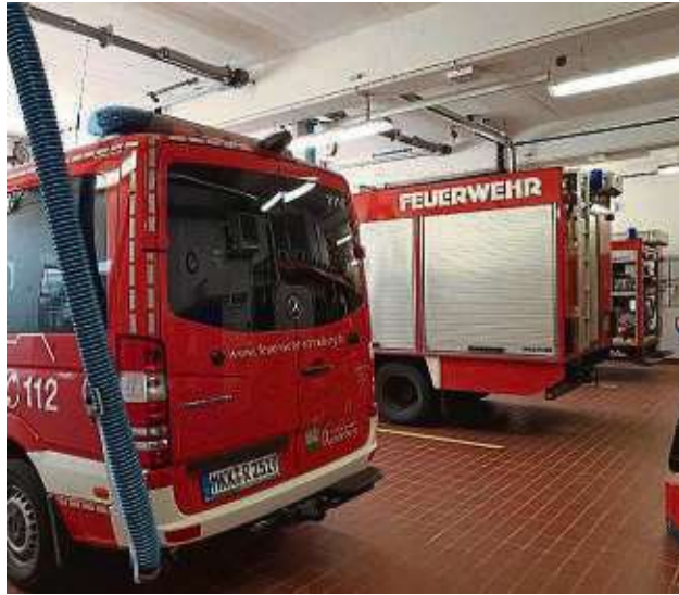
Zu eng: Die Fahrzeughalle der Hüttengesäßer Feuerwehr reicht künftig nicht mehr aus. Ein Umbau des nahe gelegenen Bauhofs wäre teuer. Daher fordert der Ausschuss die Prüfung aller Alternativen.