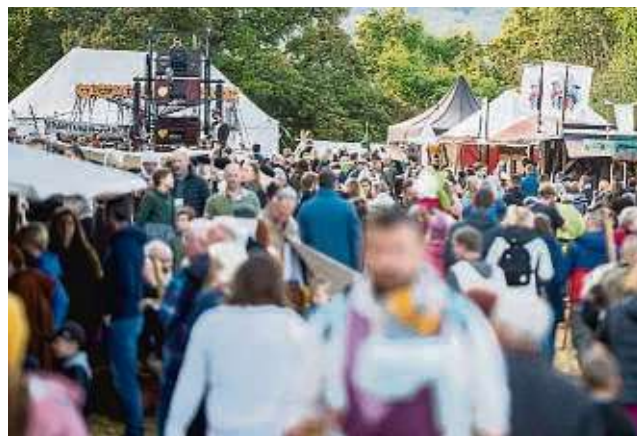
Viele Besucher werden wieder erwartet zum historischen Ostermarkt auf der Burg Ronneburg.

Weitere Informationen beim Burgmuseum Ronneburg, Auf der Burg 1, ☎ 06048 950905, E-Mail: museum@burg-ronneburg.de oder unter www.burg-ronneburg.de . ari