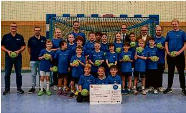
Der Handballnachwuchs der HSG Hanau sowie die Vereinsführung freuen sich über die finanzielle Unterstützung durch den Lions Club Hanau.

Den Betrag wollen die Grimmstädter für ihre aktuellen und zukünftigen Handballferiencamps nutzen. Unter anderem wurde neues Trainingsmaterial angeschafft. Das nächste Camp ist bereits für die kommenden Osterferien geplant.