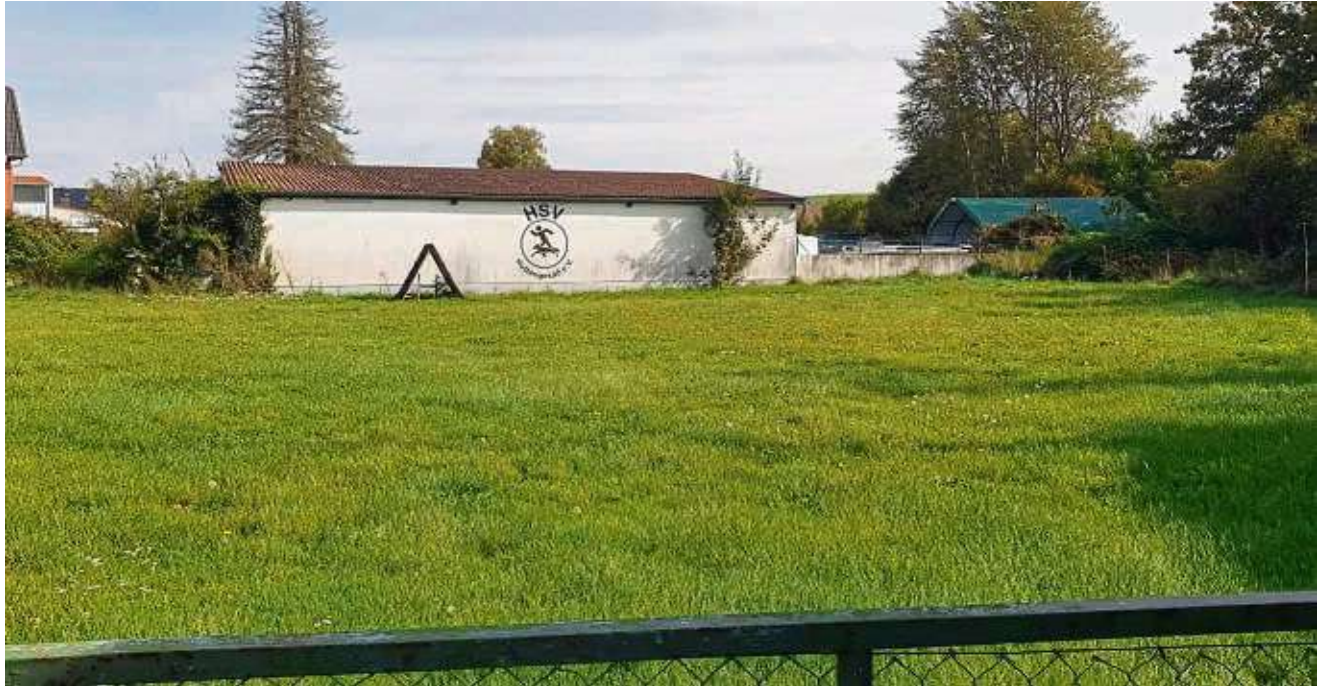
Die Gemeinde hat das Gelände des Hundesportvereins in Hüttengesäß zurückerhalten. Hier soll ein kombinierter Bauhof/Wertstoffhof-Standort entstehen.

Bei den Prüfungen des Fahrzeugkonzepts der Freiwilligen Feuerwehr mit den Neuanschaffungen des Gerätewagen Logistik (GW-L), der im Spätsommer 2024 übergeben werden soll, und dem Löschgruppenfahrzeug (LF 10) wurde festgestellt, dass die Stellplatz-Größen und Stellplatz-Verteilung im Feuerwehrhaus in Hüttengesäß