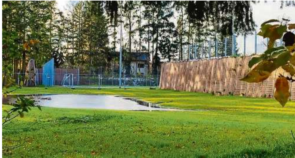
Planungsfehler? Nicht nur am Kleinspielfeld, auch zwischen den Hauptspielfeldern klaffen in Richtung Wohnbebauung im Lärmschutzwand des Sportzentrums Dicke Buche in Dörnigheim mehrere Meter breite Lücken.

Auf den Bau der Lärmschutzwand mussten die An-