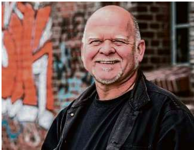
Tritt im Café Amadeo auf: Café Amadeo.

Ein Jahresrückblick von A bis Z, über die Zeit zwischen Januar und Dezember, frech,