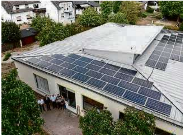
Auf vielen öffentlichen Gebäuden in Bruchköbel befinden sich Photovoltaikanlagen: Unser Bild zeigt die Kita Hasenburg.

Voraussetzung für den Beitritt war die Unterzeichnung der Bündnis-Charta, und dass Bruchköbel einen Klima-Aktionsplan vorlegt. Dieser Plan sieht unter anderem vor, über ein Förderprogramm den besagten Klimaschutzmanager einzustellen, der