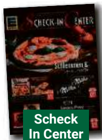
Scheck In Center