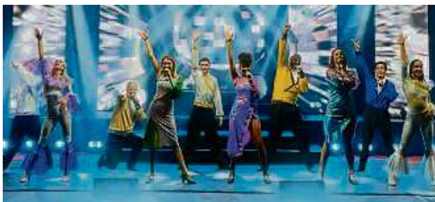
Eine Kinderchorgruppe aus Langenselbold soll zusammen mit den Musicaldarstellern in der Klosterberghalle singen.

Langenselbold – Einmal im Rampenlicht stehen und zusammen mit professionellen Darstellern auftreten – dies könnte für einen Kinderchor aus der Region Realität werden. Denn am Sonntag, 14. April, kommt „The World of Musicals“ in die Klosterberghalle. Die Musical-Gala bietet die besten Songs aus 100 Jahren Musicalgeschichte mit Hits aus „Der König der Löwen“, „Mamma Mia“, „Frozen“, „Evita“, „Das Phantom der Oper“, „Les Misérables“ und vielen anderen mehr.