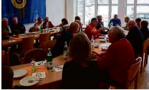
Etwa 30 Gäste fanden sich zur Premiere des Selbolder Projekts „Eintopf“ im Katharina-von-Bora-Haus ein, um den ersten Mittagstisch zu genießen.

Wissler zeigte sich insbesondere darüber begeistert, dass es von der ersten Idee im