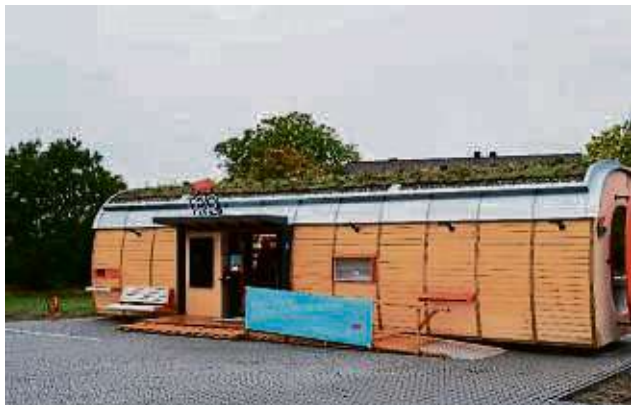
Der Teo in Oberrodenbach kam als einzige Möglichkeit für die Nahversorgung im Ortsteil infrage.

Aufgrund dieses Beschlusses sei das Konzept der Tegut-Supermärkte mit ihren voll automatisierten Verkaufsmodulen – kurz „Teo“ genannt – generell infrage gestellt, da es das Alleinstellungsmerkmal ihres Konzeptes sei, die Nahversorgung von Bürgern in