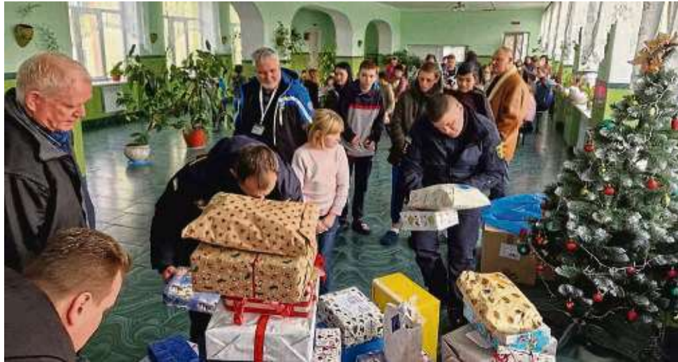
500 Weihnachtspäckchen umfasste der Hilfstransport, den die Reservistenkameradschaft Hanau nach Lemberg in die Ukraine brachte.

„Seit Kriegsbeginn in der Ukraine haben wir rund 60 Fahrten unternommen, mal mit Hilfsgütern, mal mit gespendeten Feuerwehrautos“, sagt er. Den Transporter stellt die Freiwillige Feuerwehr, das Geld für den Sprit spen-