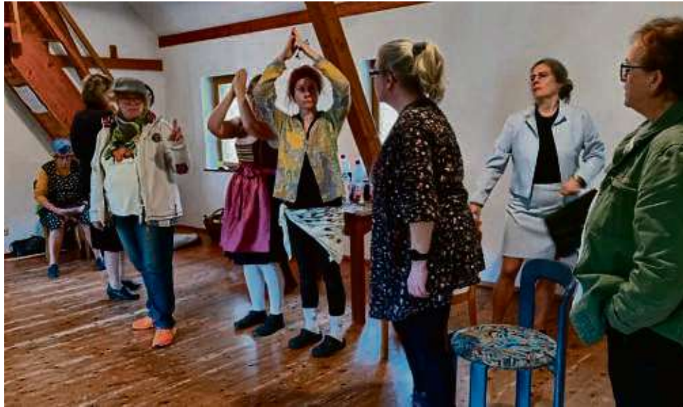
Von Anfang an rumort es unter den Darstellern des Ensembles – allerdings nur im Stück, nicht bei der echten Frauentheatergruppe.

Und das wird morbide, wie man der Ankündigung entnehmen kann: Denn es rumort schon von Anfang an bei den Proben (nicht bei der echten, sondern der gespielten Theatergruppe) heftig unter den Darstellern des Ensembles, denn die ehrgeizige Bürgermeisterin hat der Gruppe ohne Absprache einen renommierten Regisseur samt zwei Profidarstellern vor die Nase gesetzt, angeblich um das Prestige des kleinen Dorfes zu heben. Dummerweise stirbt bei den ers-