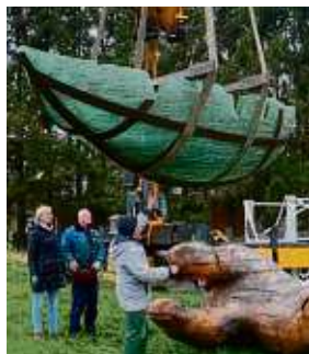
Mithilfe eines Krans wird das Kunstwerk auf der Wiese installiert.

Gut zwei Stunden dauerte es, bis zunächst per Kran das dreieinhalb Meter lange Glasboot und dann die riesige