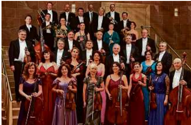
Das Johann-Strauss-Orchester gastiert in Rodenbach.