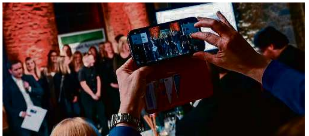
Erinnerungsfotos werden sicher auch diesmal wieder gemacht, wenn die Titel HANAUER Sportlerin, Sportler und Mannschaft des Jahres vergeben werden.