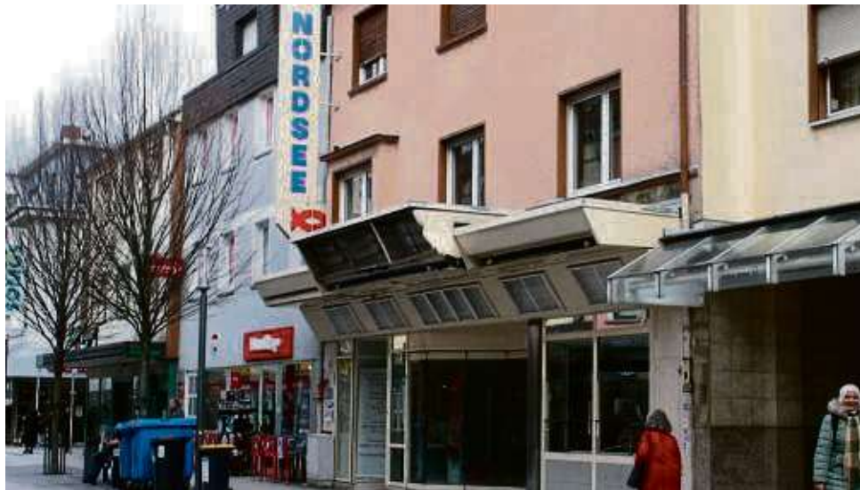
40 Jahre lang war das Geschäft Teil des Stadtlebens, kürzlich wurde es endgültig geschlossen.

Die Stadt Hanau beziehungsweise deren Marketing-