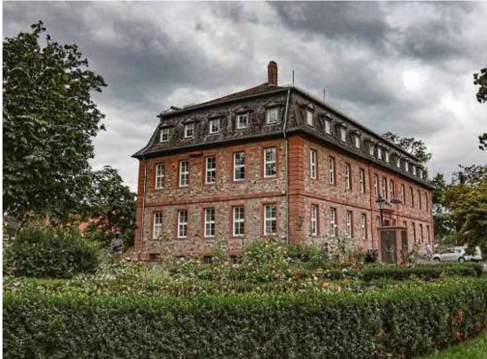
Dunkle Wolken über dem Rathaus: Die Fluktuation bei den Mitarbeitern hat in den vergangenen Jahren zugenommen, die Stadt will dieser auch mit einer verbesserten Möglichkeit des Homeoffice entgegenwirken.

Wie Bürgermeister Timo Greuel in seiner ausführlichen Beantwortung ausführte, seien in den städtischen Kitas derzeit vier Stellen unbesetzt. Darüber hinaus könne man drei Stellen nicht besetzen, da sich aus den Stellenausschreibungen „keine (qualitative) Auswahl an Bewerbern“ ergeben habe. Gesucht werden Mitarbeiter für die administrative Betreuung der EDV bei der Feuerwehr,