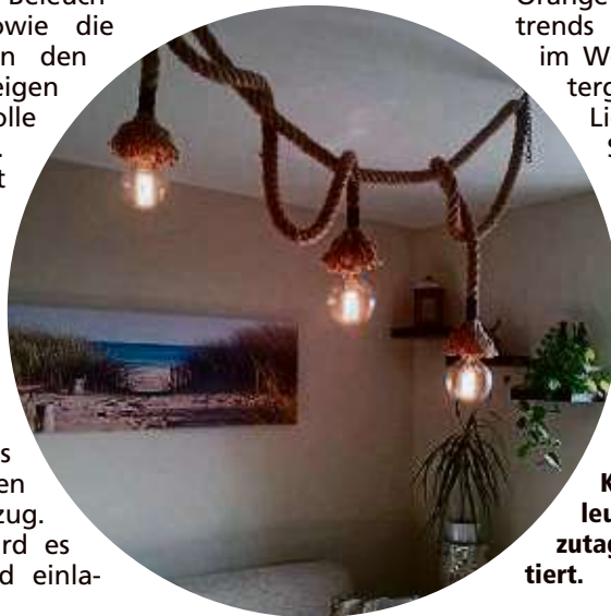
Klassische Hängeleuchten werden heutzutage modern interpretiert.

renabteilungen der Kauf-häuser können dank der Vielzahl der zur Auswahl ste-henden Artikel die Farbtöne und das Design des Geschirrs aufeinander abgestimmt werden. Blau, Gelb und Orange zählen zu den Farb-trends bei den Sitzmöbeln im Wohnraum oder Win-tergarten. Als einzelne Lieblingsstücke setzen Sessel oder Sofa farb-liche Highlights im Zimmer, ohne dass es überladen wirkt.