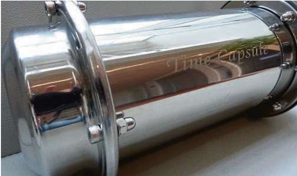
75 solcher Zeitkapseln sollen Maintaler Stadtgeschichte bewahren. Privatpersonen, Vereine und Unternehmen können sich bis Ende Januar bewerben.

Maintaler können sich bis Ende Januar eine eigene Zeitkapsel sichern