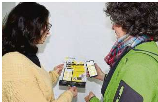
„Integreat-App“ feiert ersten Geburtstag.