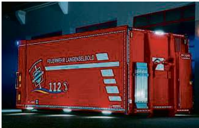
Der Abrollbehälter kann bei schlechtem Wetter als „improvisierter Aufenthaltsraum“ genutzt werden.

Neben dem bereits 2022 in Dienst gestellten Wechsellaaderfahrzeug-Kran, das vom Land Hessen beschafft wurde, erwartet die Feuerwehr im ersten Quartal 2024 zwei weitere Wechsellaaderfahrzeuge, die vom Kreis und von