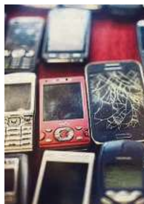
Irgendwann ist jedes Mobilgerät Schrott.

Durch die Initiative konnten bisher mehr als 26 Kilogramm Kupfer, 437 Gramm Silber, etwa 73 Gramm Gold und viele andere Rohstoffe