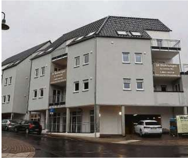
Kurz vor der Vollendung: die Wohnanlage an der Frankfurter Straße 16b in Kilianstädten. Nach acht Jahren ist das Objekt an prominenter Stelle im Ort endlich fertiggestellt.

Das Projekt wird gut angenommen, schnell sind die