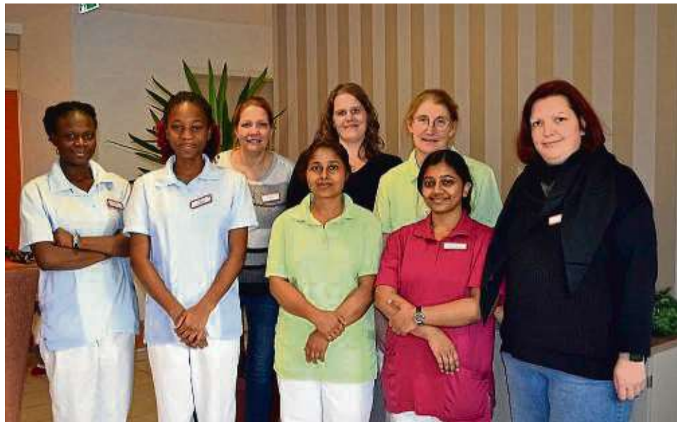
Vier neue Kolleginnen aus Indien und Togo kann das Maintaler Team willkommen heißen.

neuen Kolleginnen natürlich unterstützt. Jedoch gestaltete sich alles, was erledigt werden musste, von der Einrei-