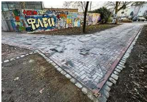
Der Zuweg über den Erlenpark wurde instand gesetzt und Pflasterflächen angelegt, sodass die Bürgerinnen und Bürger trockenen Fußes zum Servicebüro gelangen.

Während der Sanierungsphase werde es deshalb immer wieder zu Einschränkungen im öffentlichen Bereich kommen, die nicht vermieden werden könnten. „Alle an dem Projekt Beteiligten werden jedoch alles daran setzen, dass diese Einschränkungen auf ein notwendiges Mindestmaß beschränkt bleiben.“ sam