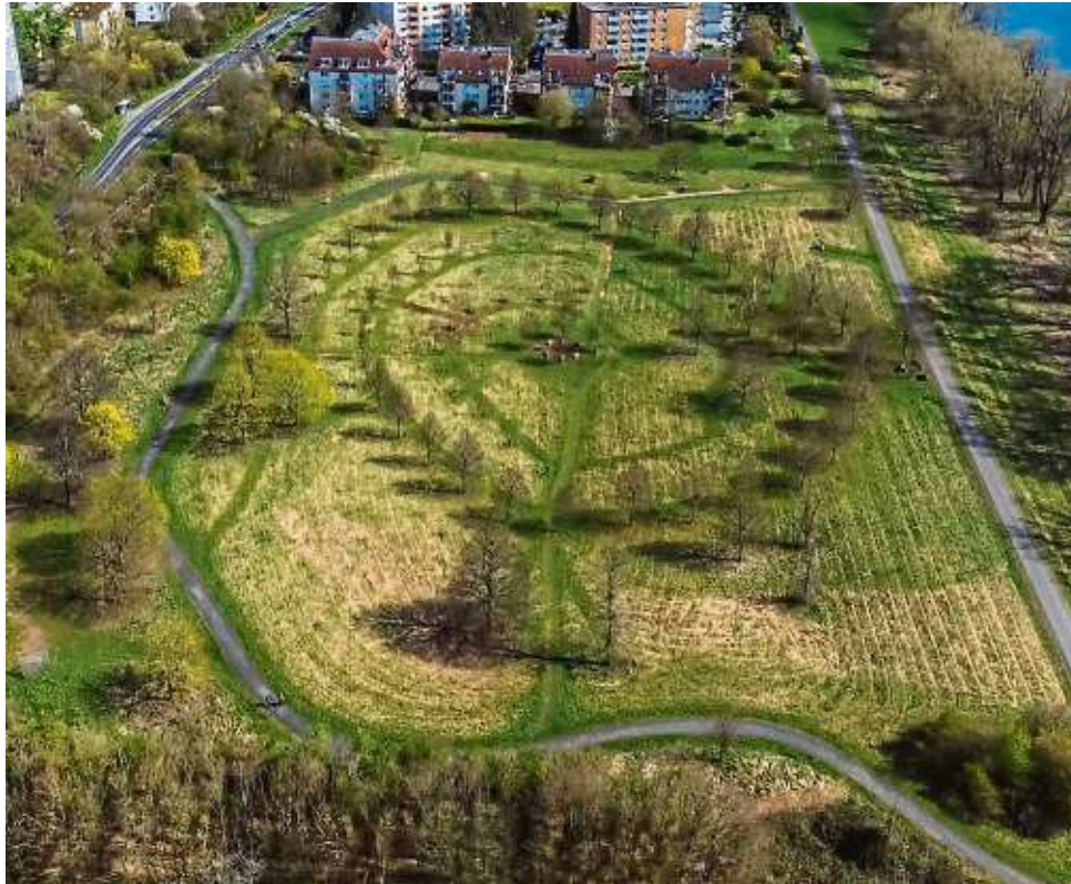
Im Frauenhain in Dörnigheim werden in diesem Jahr Monika Bartels und Karin Müller geehrt.

Zur Ehrung im Frauenhain am Sonntag, 3. März, sind um 14 Uhr alle Interessierten in den Frauenhain am Dörnig-