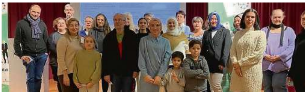
Mitglieder des Vereins „Menschen in Hanau“ haben auf ein aktives 2023 zurückgeblüht.

Weitere Informationen im Internet unter menschen-in-hanau.eu. upn