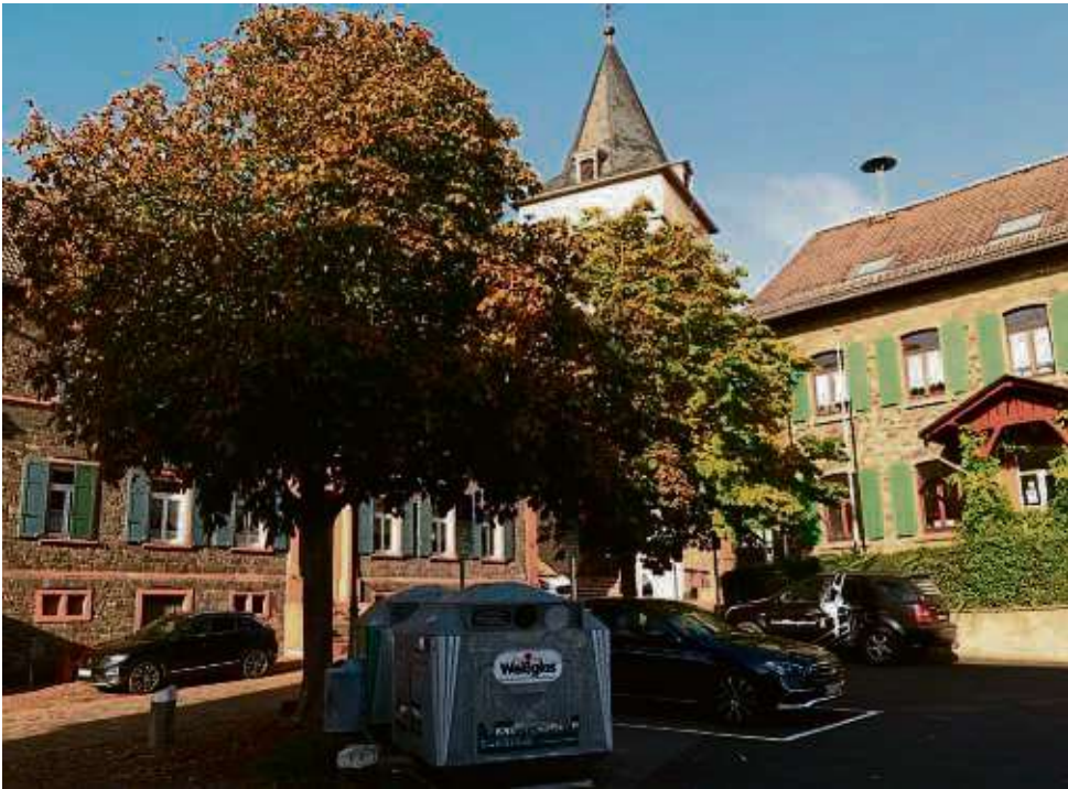
Der geografische Mittelpunkt Maintals liegt unweit der Hochstädter Kirche. Dort soll bis Ende dieses Jahres ein öffentliches Kunstwerk aufgestellt werden.