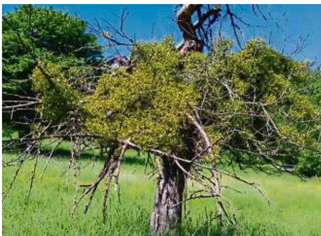
Entzieht dem Baum Wasser und Nährstoffe: Die Entfernung von Misteln gehört auch zu den Aufgaben des LPV.

Um deren Erhaltung bemüht sich der Landschaftspflegeverband Main-Kinzig-Kreis (LPV) seit vielen Jahren. Aktuell finden in Maintal und Nidderau großflächige Sanierungsarbeiten an mehr als 500 alten Obstbäumen statt, weiterhin wurden mehr als 200 neue Obstbäume – in der Regel hochstämmige Äpfel, Birnen, Kirschen und Zwetschen – gepflanzt. Für Herbst-