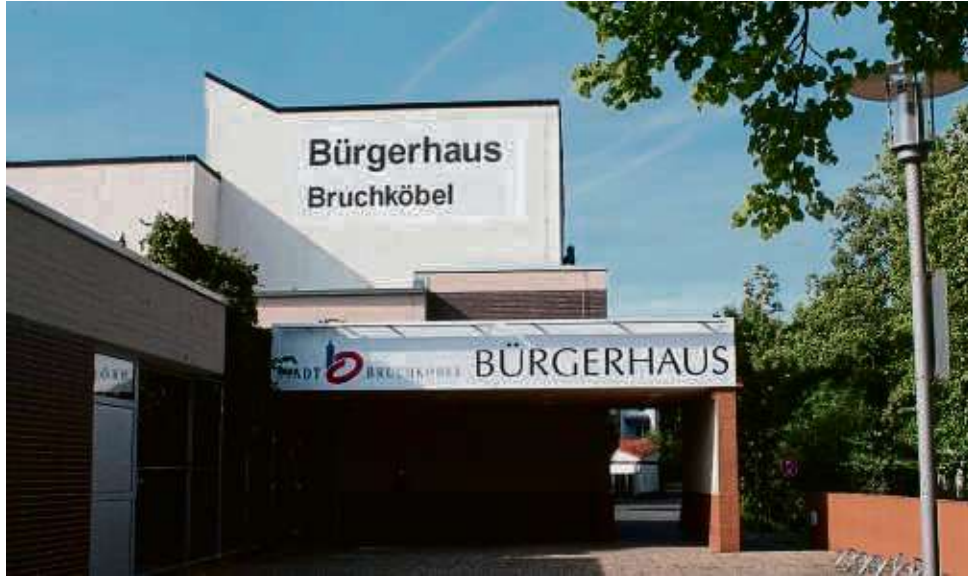
Für die Öffentlichkeit schon lange geschlossen: das Bruchköbeler Bürgerhaus, dessen Abriss laut Investor nun im April beginnen soll.

Zurzeit befindet sich der Bauantrag noch zur Prüfung bei der Bauaufsichtsbehörde des Main-Kinzig-Kreises. „Wir sind zuversichtlich, dass wir die Baugenehmigung im Frühjahr erhalten“, berichtet eine Unternehmenssprecherin der Bonava Deutschland GmbH. Die Vorbereitungen für den Abriss liefen, voraussichtlich würde im April mit den Arbeiten begonnen. „Da sowohl Abriss als auch