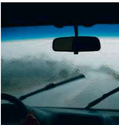
Damit man stets einen klaren Durchblick hat, sollte man auf das richtige Scheibenwischwasser achten.

zehn Grad. Experten raten zu einem Frostschutz von bis zu minus 20 Grad. Bei Fertigmischungen kann man jene wählen, die den gewünschten Frostschutzwert aufweist und diese direkt in die Wischanlage füllen. Ips/AM.