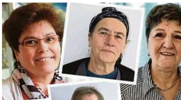
Geschichten vom Ankommen in einem fremden Land hat die städtische Integrationsbeauftragte gesammelt.

Die ersten Zuwanderungsgeschichten sind ab sofort auf der Homepage der Stadt Maintal zu lesen. Sie können auf der Jubiläums-Webseite unter www.Maintal.de/50jahremaintal aufgerufen werden. Weitere Geschichten folgen. Geplant ist zusätzlich eine Ausstellung der Geschichten im Rathaus, die bereits in Vorbereitung ist. kbr