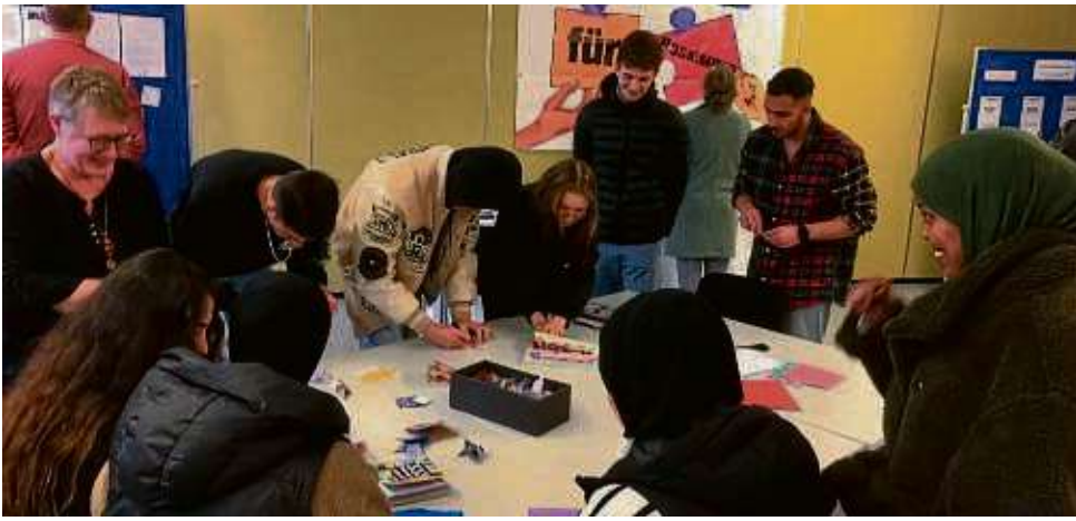
Jugendliche der Ludwig-Geißler-Schule haben anlässlich des Jahrestages des Hanau-Attentats Friedenssymbole gestaltet und sich intensiv mit der Frage auseinandergesetzt, wie ein friedliches Miteinander vonstattengehen kann.