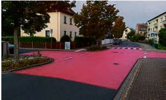
Der Kreuzungsbereich von Rumpenheimer Weg, Alter Dorfstraße und Löwenseestraße nach den Markierungsarbeiten.

Maintal – Der Rumpenheimer Weg gehört zu den Hauptverkehrsstraßen in Bischofsheim. Er verbindet den Fehenheimer Weg mit der Straße Am Kreuzstein. Im Rahmen einer Online-Umfrage konnten Bürger bewerten, welche Maßnahmen sie bei der Umgestaltung des Rumpenheimer Wegs für relevant erachten. Dabei befürwortete die Mehrheit Maßnahmen zur Verkehrsberuhigung, etwa durch die optische Hervorhebung der Kreuzungsbereiche.