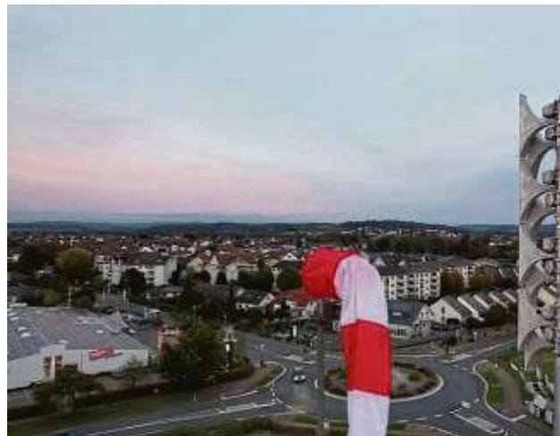
Elektrische Lautsprecher erzeugen den Sirenton.

Weitere Infos finden sich auf der Webseite der Feuerwehr Langenselbold unter feuerwehr-langenselbold.de/sirenen . par