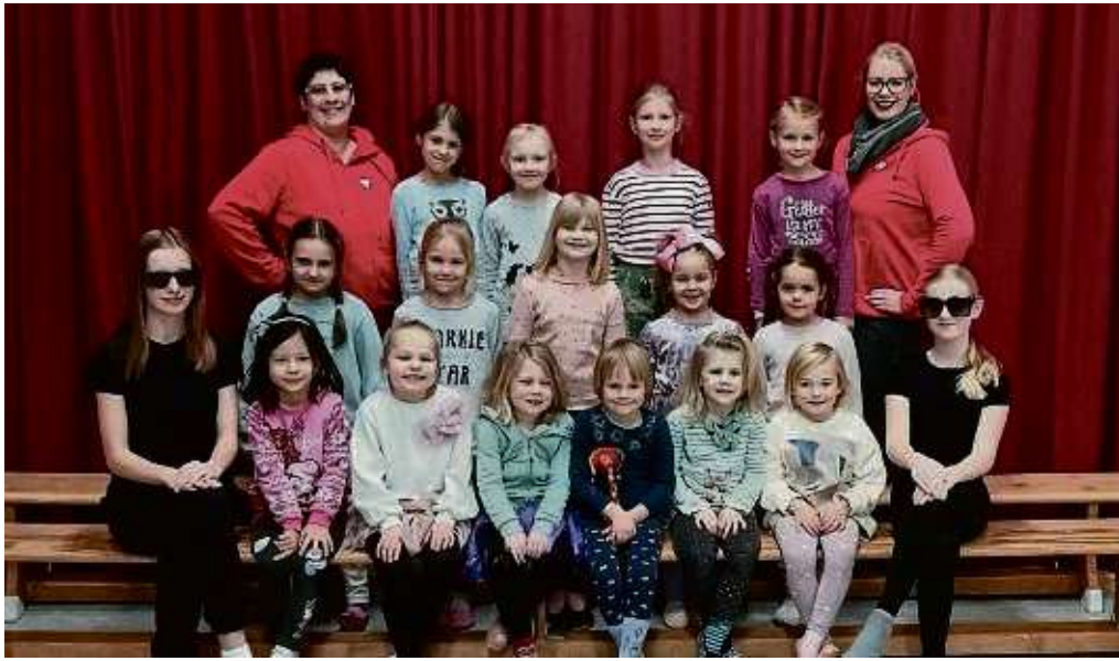
Die Bambinis der Rot-Weißen und ihre Trainerinnen freuen sich auf ihre Auftritte.