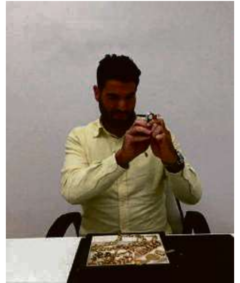
Ihr Spezialist für Goldankauf.