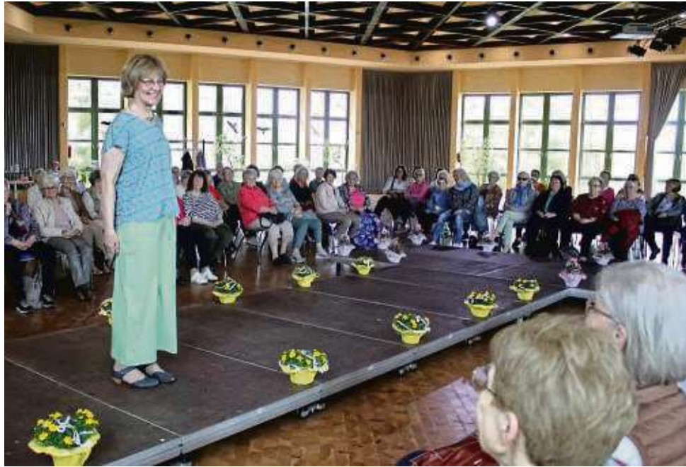
Große Resonanz findet bei den Senioren stets die Modenschau „Chic in den Frühling“. Unser Bild stammt aus dem Mai 2023.