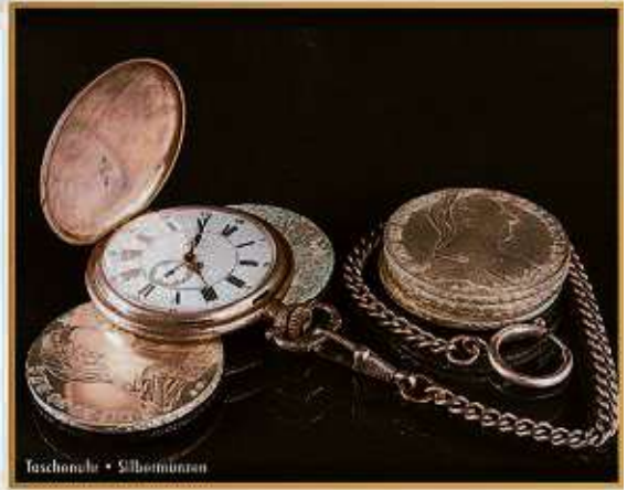
Faschonuhr • Silbermünzen

aus dem Tresor zu holen und diese den Experten vorzulegen. Laut Experten kann beispielsweise eine Rolex GMT Master aus den 70er Jahren bis zu 9.000 EUR erzielen. Des Weiteren bieten die Experten von »Bares für Wa(h)res« kostenlose Wertschätzung von Diamanten an. Besonders interessant sind Diamanten im Brillant-Schliff ab einer Größe von 0,50 Carat. Hier gilt immer die Faustregel: ein einzelner großer Diamant ist wertvoller als viele kleine Diamanten. Ein Besuch bei den Experten lohnt sich in jedem Fall, denn hier wird Ihr Schatz professionell taxiert und zu einem fairen Preis entgegengenommen.