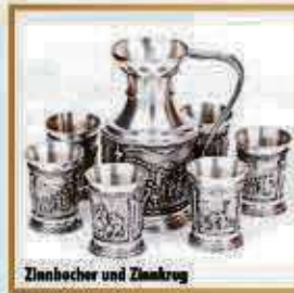
Zinnhocher und Zinnkrug