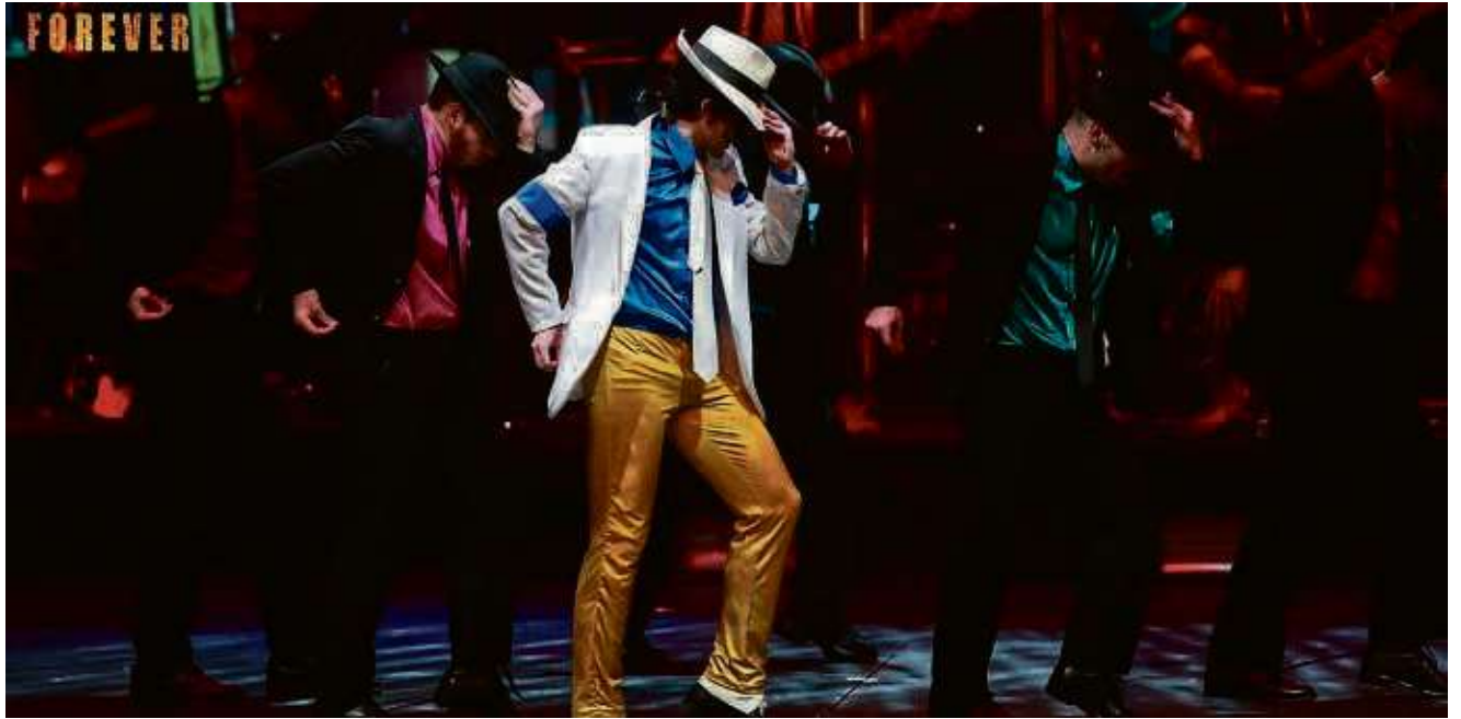
Der King of Pop steht im Mittelpunkt des Tribute-Konzerts in der Alten Oper Frankfurt.