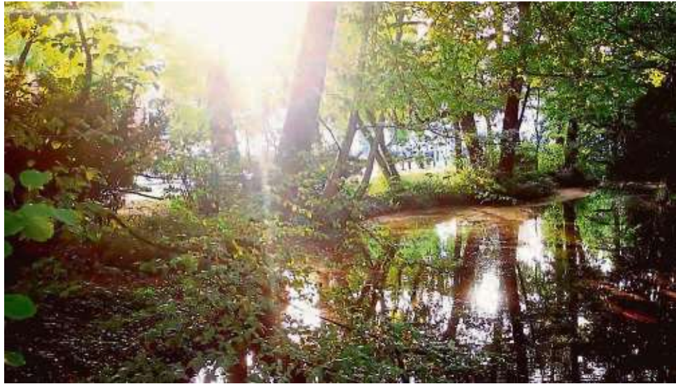
Sonne, Wasser, Wald: Der Umgang mit Natur und Ressourcen ist ein wichtiges Themenfeld der Arbeitsgruppen der Initiative Bürger im Gespräch, die sich vor einem Jahr in Schöneck gegründet hat.