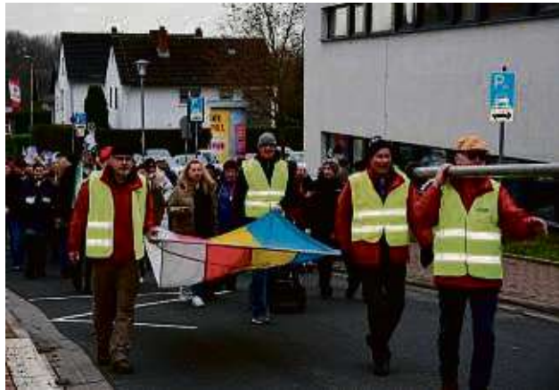
Trugen die Fahne durch den Ort: Die Hochstädter Käwern läuteten die Karnevalssaison ein.

Nach diesen traditionellen Akten des närrischen Brauchtums sorgte das Prinzenpaar für das leibliche Wohl der Gemeinschaft. Heiße und kalte Getränke sowie köstliche Kuchen wurden im geselligen Käwernhof gereicht, wo Mitglieder befreundeter Vereine, sowohl aus der Nähe als auch von weiter her, sowie engagierte Käwer die festliche Atmosphäre gemeinsam genossen. Diese gelungene Feier