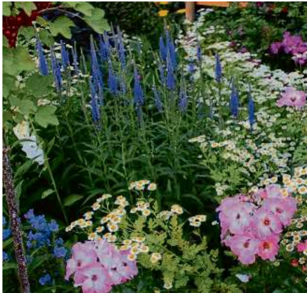
Die „Bienenweide“ in voller Blüte: Gewinnergarten des Wettbewerbs „Schönecks blühende Gärten“ aus dem Jahr 2020.