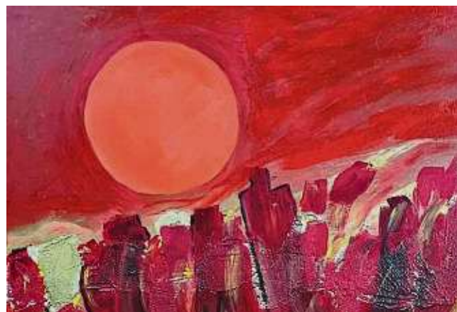
Malkursteilnehmerinnen des Ateliers Mirka Seidel präsentieren große Vielfalt.

Prozesse hinter den Werken zu entdecken, wird in der Ankündigung erläutert. Von expressiven Farblandschaften bis zu subtilen Kompositionen zeigten sie eine beeindruckende Bandbreite an kreativen Ansätzen.