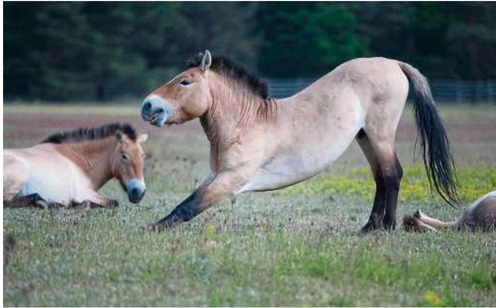
Die Przewalski-Pferde auf dem ehemaligen Panzerübungsplatz Campo Pond bei Hanau.

Der Fliegerhorst wurde in den 1930er Jahren von der Luftwaffe im Dritten Reich angelegt und nach dem Krieg von den US-Streitkräften bis 2007 genutzt. Gut 100 Hektar des 240 Hektar großen Geländes sind für Gewerbebetriebe