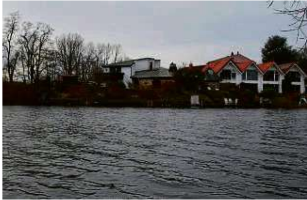
Das Wohngebiet an der Naßmühle zwischen der Kahl und dem See Emma-Süd ist durch einen Zufahrtsdamm mit dem Ort verbunden.