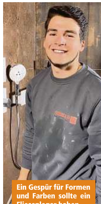
Ein Gespür für Formen und Farben sollte ein Fliesenleger haben.

Der Handwerkmangel in Deutschland spitzt sich zu: Ende April vermeldete der Zentralverband des Deutschen Handwerks knapp 40.000 unbesetzte Ausbildungsstellen. Damit gefährdet der Nachwuchsmangel nicht nur den Wohnungsbau, sondern auch die Energiewende - für die dringend mehr Handwerker im Heizungs-, Sanitär- und Klimabereich sowie Elektro-Installateure nötig sind. Aber auch Nachwuchshandwerker bei den Profi-Fliesenlegern. Denn die Meister- und Innungsbetriebe des Fachverlege-Handwerks tragen dazu bei, Gebäude nachhaltiger und klimafreundlicher zu machen: Fliesen sind mit ihrem ausgezeichneten Wärmeleitverhalten der optimale Systempartner zu Wärmepumpe und Fußbodenheizung - ökologisch verträglich, langlebig und „renovierungssicher“.