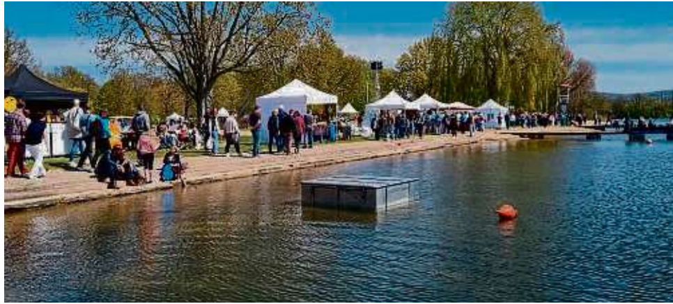
Das idyllische Gelände am See ist zum sechsten Mal Schauplatz des großen Gartenfests mit Pflanzen- und Gartenaccessoire-Verkauf.

Experten, heißt es in der Mitteilung, vermittelten den Besuchern auf Wunsch Informationen über Gartengestaltung und -pflege, Besucher bekommen außerdem Anre-