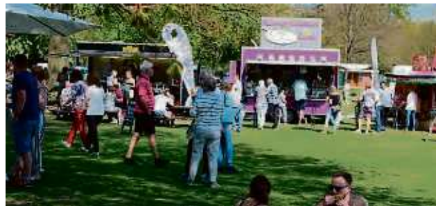
Beim Streetfoodmarkt werden bis zu 30 Stände mit internationaler Küche erwartet.

gungen für Gestaltungsmöglichkeiten und können sich mit aktuellen Innovationen vertraut machen, wenn Hersteller ihre Produkte und Trends vorstellen. Hinzu kommt, wie gewohnt, eine große Streetfood-Meile, mit „Essen von der Hand in den Mund“. Wieder wehe ein Hauch von Fernweh und exotischen Gewürzen durch das Strandbad, teilt der Veran-