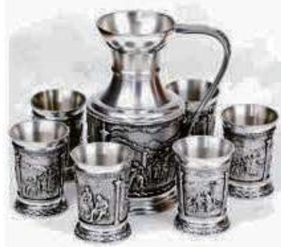
Zinnkrug und Zinnbecher

jetzt Bernsteinschmuck als große finanzielle Überraschung entpuppen. Für besonders schöne Honigbernsteinketten, im Idealfall in Oliven- oder Kugelform, kann man schon mit ein paar Hundert bis zu mehreren Tausend Euro rechnen. Aufgrund der stark wachsenden Nachfrage aus dem Ausland hat sich der Preis für besonders schöne Stücke in den letzten 7 Jahren verzehnfacht. Es lohnt