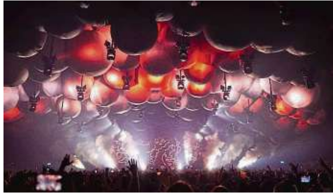
Die Time Warp verbindet visuelle Effekte mit dem Nonplusultra der elektronischen Musik – und das seit 30 Jahren.