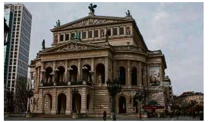
Die Alte Oper bietet in Kooperation eine Hausführung an.

Alten Oper sowie in der teilnehmenden Straße. Bürger einer Nachbarschaft werden im Projekt dabei unterstützt, Musik in ihre Wohnungen, ihre Vorgärten oder Hinterhöfe, auf ihre Plätze zu bringen. Möglich sind etwa Konzerte von Profimusikern, die über die Alte Oper vermittelt werden, eine entspannte Hinterhof- oder Straßenumusik, Hauskonzerte aus den Reihen der Nachbarschaft, eventuell auch im Einklang mit dem Musikvermittlungsprogramm „Pegasus“ der Alten Oper, Kinder-, beziehungsweise Familienkonzerte und vielleicht ein Fest zum Abschluss des Projekts. Umgekehrt lädt die Alte Oper die Teilnehmer mehrmals zu sich ein – zum Besuch ausgewählter Konzerte sowie zu einer exklusiven Führung durch das Haus. Infos gibt's online auf alteoper.de/strasse.