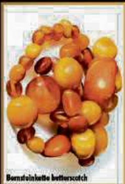
Bernsteinkette baltischer Art

Nutzen Sie diese einmalige Chance! Kostenlose Wertschätzung und Barankauf vor Ort.