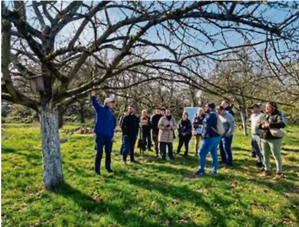
Die Teilnehmer lernen auf der Streuobstwiese in Sossenheim mit Bäumen umzugehen.

Im folgenden Praxisteil konnte das erworbene Wissen dann direkt angewendet werden. In Gruppen wurden die auszuführenden Schnitтарbeiten unter den einzelnen Bäumen besprochen, bevor Säge, Schere und Schneidgiraffe zum Einsatz gekommen sind. Einen Pflegeeinsatz veranstalteten die Teilnehmer dann am Sonntag. Der Fokus lag auf dem Schneiden der Bäume. Zunächst wurden auch an diesem Termin die notwendigen Kenntnisse vermittelt. Am Ende der Veranstaltungen