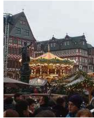
Weihnachtsmarkt: Gut besucht.

war das Jubiläum des 175. Jahrestags der ersten Nationalversammlung in der Paulskirche. Rund 250.000 Gäste besuchten das Fest mit knapp 160 Programmpunkten und Projekten. Zu den musikalischen Highlights zählte der World Club