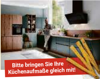
Bitte bringen Sie Ihre Küchenaufmaße gleich mit!