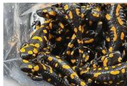
Die geretteten Salamander.

Dort wurde vermutet, dass die Tiere aus Osteuropa stammen, sodass die Polizei von unerlaubter Einfuhr, unerlaubtem Transport sowie versuchtem Handel ausgeht und entsprechende Strafanzeigen fertigte.