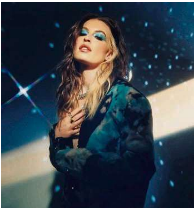
Fletcher kommt auf ihrer Tour auch nach Frankfurt.

Unterliederbach (red) – Fletcher ist eine amerikanische Sängerin und Songwriterin. Ihre bahnbrechende Single „Undrunk“ wurde im Januar 2019 veröffentlicht und war ihre erste Single, die es in die „Billboard Hot 100“ schaffte. Fletcher wird von führenden Medien wie Time, Wonderland, Harper's Bazaar, Interview Magazine, GQ, The Guardian und anderen gelobt und stammt aus Asbury Park, New Jersey, wo sie ihre Leidenschaft für Musik und ihr unvergesslich offenes Geschichtenerzählen pflegte. Nach ihrem Abschluss am berühmten Clive Davis Institute for Recorded Music der NYU erarbeitete sich Fletcher einen eigenen Platz in der Popmusik und veröffentlichte 2019 ihre Debüt-EP „You ruined New York City for me“ über Capitol Records. Die viel gelobte