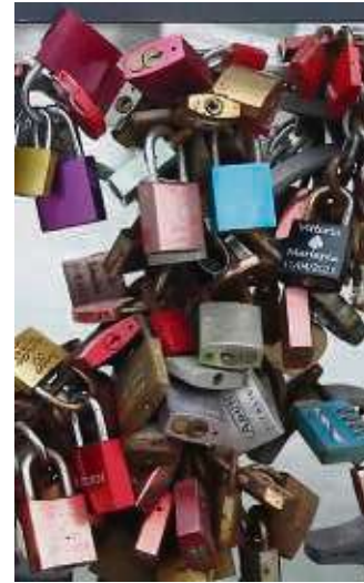
Rostige Anhänger sind zu finden, aber auch relativ frisch gravierte.

ten möchten; ob geheiratet wurde, Kinder aus der Beziehung hervorgegangen sind, ausgewandert wurde, die Verbindung in die Brüche ging oder vielleicht eine Freundschaft daraus wurde. Lustige, traurige, wundervolle Anekdoten, wir freuen uns über alles, woran wir teilhaben dürfen.