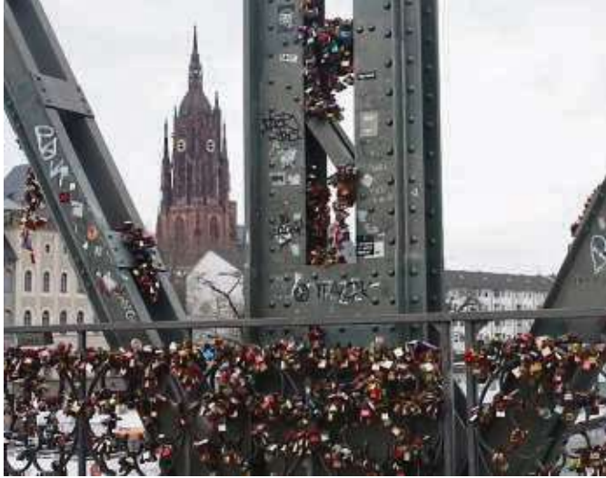
Unzählige Schlösser für die Liebe hängen am Eisernen Steg, die Paare gemeinsam angebracht haben. Vielleicht ja auch Ihres?

Interessant sind alle Geschichten, die Sie uns verraten