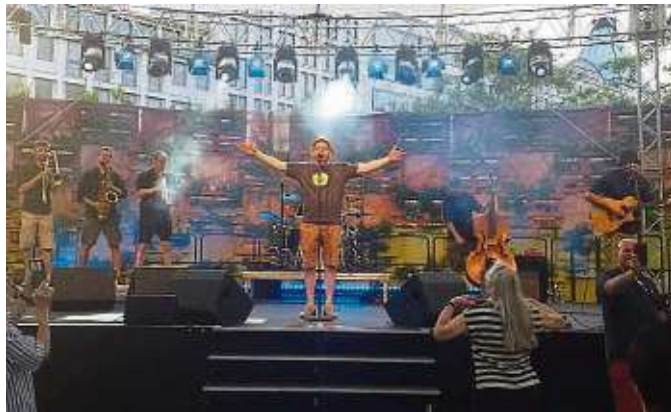
Revolte Tanzbein beim Grüne-Soße-Festival auf dem Roßmarkt.