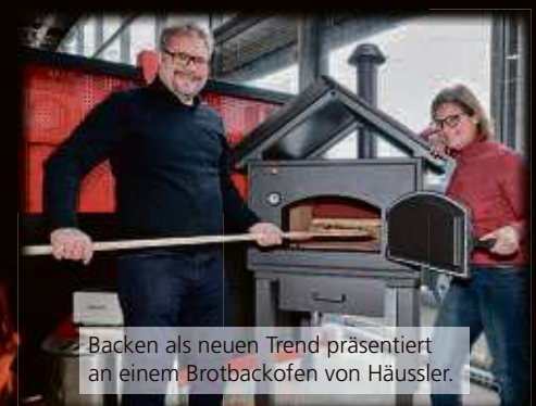
Backen als neuen Trend präsentiert an einem Brotbackofen von Häussler.

360 Grad BBQ in der Hanauer Landstraße 427 hat montags bis freitags von 10 Uhr bis 19 Uhr sowie samstags von 10 Uhr bis 18 Uhr geöffnet. Telefon: 069 87009720. Fotos/Text: peba