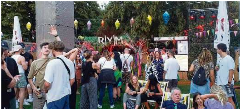
Beim Museumsuferfest wurde gechillt und getanzt, gefuttert und geschwätzt. Das Wetter passte und die Stimmung war ausgelassen. Besser konnte es eigentlich nach den Beschränkungen nicht laufen.

Am 18. Mai 2023 feierten rund eine Viertelmillion Besucher zwischen Paulsplatz und Mainufer das Paulskirchenfest. Anlass