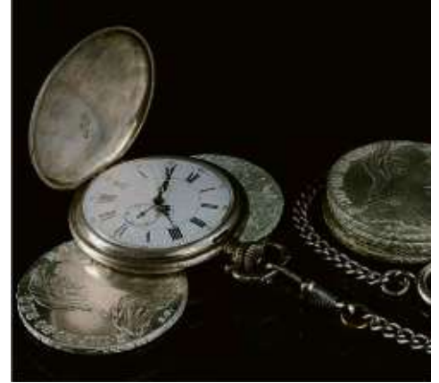
Taschenuhr und Silbermünzen

Berliner Straße 66 (am Theatertunnel) 60311 Frankfurt Innenstadt Tel. 01578 5072282