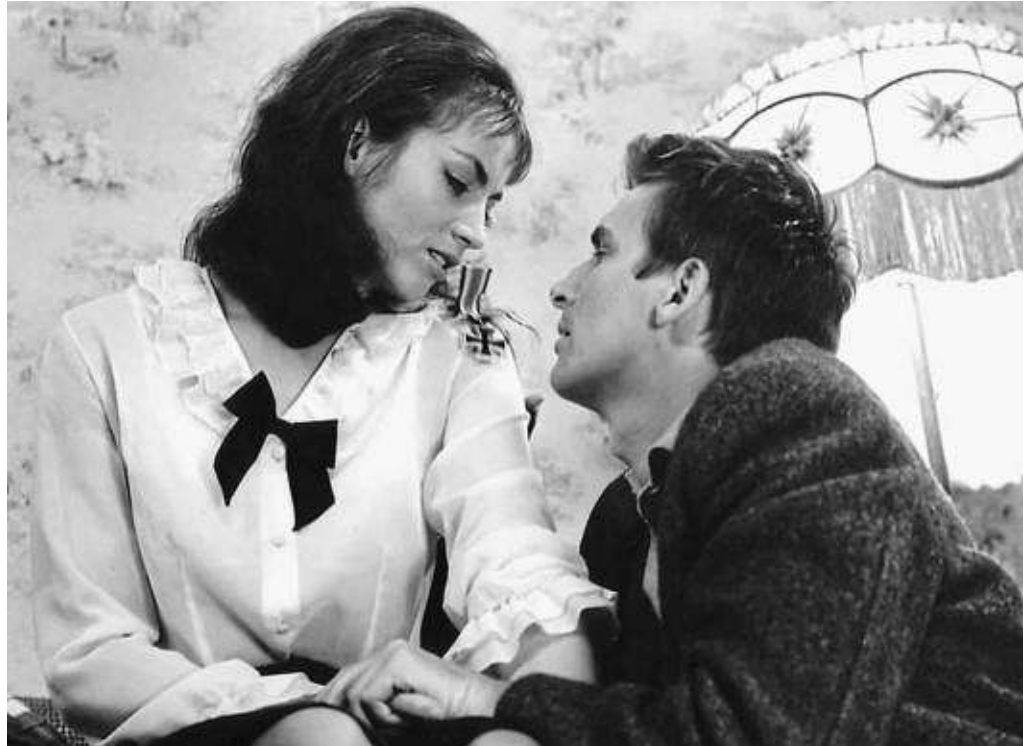
Peter Schamonis Film „Schonzeit für Füchse“ von 1966 ist im Filmforum zu sehen.

Anlässlich des Tages der betrieblichen Mitbestimmung am 4. Februar lädt der Verdi-Bezirk Frankfurt und Region in Kooperation mit dem Filmforum für Dienstag, 30. Januar, ab 18.15 als