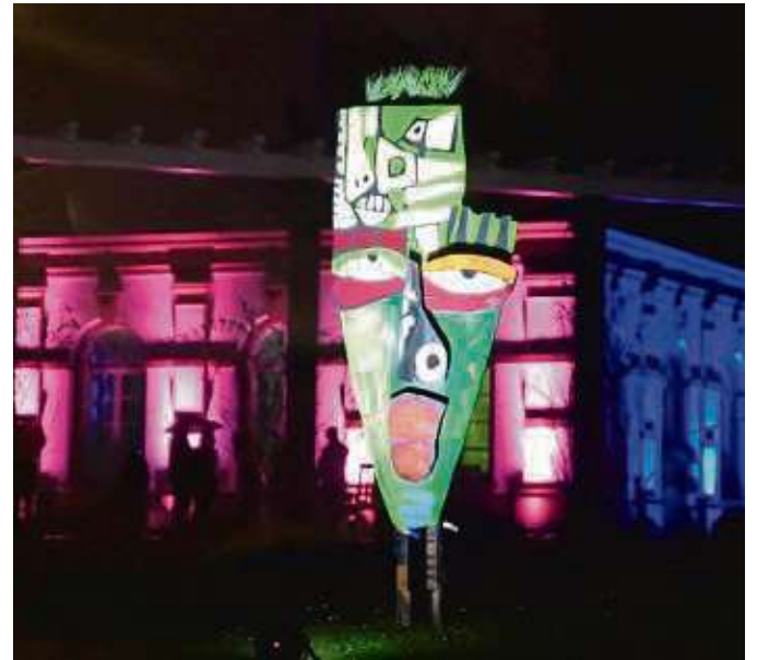
Abstrakte Gesichter sind in der Installation überall verteilt.

Wer es diesmal nicht mehr zu den „Winterlichtern“ schafft, hat noch bis zum 28. Januar Gelegenheit, die Schau „Orchideen -