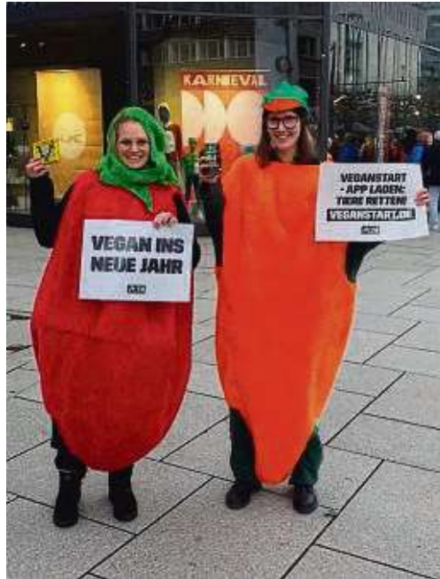
Als Gemüse verkleidet sensibilisieren Mitglieder des Peta-Streetteams für vegane Ernährung.

Peta weist darauf hin, dass viele Menschen hinter Fleisch und anderen Produkten tierischer Herkunft nicht das getötete Lebewesen sehen. Dabei werden jedes Jahr allein in Deutschland rund 800 Millionen Lebewesen getötet. Meist vegetieren sie eingepfercht und getrennt von ihren Familien in kargen und kotverdrehten Ställen oder Käfigen dahin.