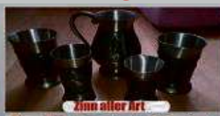
Zinn aller Art