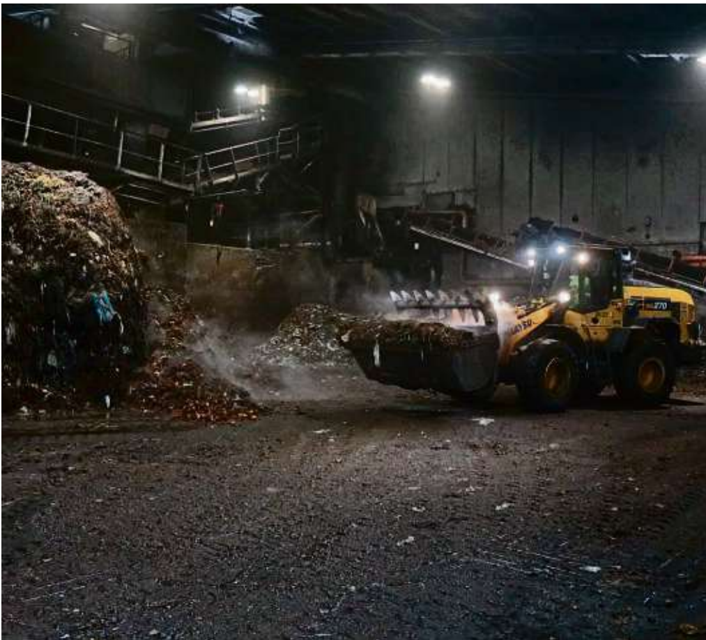
In der Rhein Main Biokompostanlage schaufelt ein Radlader den Biomüll auf, um ihn zum Zerkleinern zu transportieren.

Biosammlung in Frankfurt zwischen 1996 und 2000. Bei den Mengenangaben sind saisonale Effekte zu berücksichtigen – etwa trockene Sommer, die die Mengen vor allem beim Grünabfall reduzieren. Während der Corona-Jahre wurden hingegen teilweise zweistellige Zuwachsraten verzeichnet. Daher rührte dann auch der Modellversuch mit der wöchentlichen Leerung. 2022 wurden insgesamt 47.288 Tonnen Biomüll in der Anlage verarbeitet. Neben den Frankfurter auch Mengen kamen aus dem Kreis Offenbach 2021 50.248 Tonnen hinzu. Davon wurden 38.750 Tonnen (85 Prozent) vergoren und 6730 Tonnen (15 Prozent) kompostiert. Aus der vergorenen Bioabfallmenge sind beim Gärprozess etwa 6.190.000 Kubikmeter Biogas entstanden. Energieseitig wurden daraus knapp 24,7 Millionen Kilowattstunden Biomethan, 1,7 Millionen Kilowattstunden Strom und 2,4 Millionen Kilowattstunden Wärme. Aus den Gärresten entstanden dann rund 14.900 Tonnen Kompost und zirka 25.900 Tonnen Flüssigdünger.