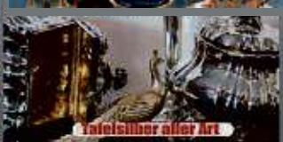
Tafelsilber aller Art

Kostenlose Begutachtung und Bewertung Ihres Schmuckstücks