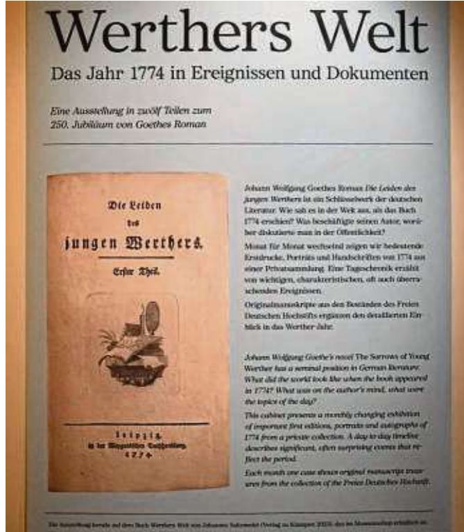
Plakat im Handschriftenstudio, ausgestellt im Romantikmuseum.

Innenstadt (jf) – 1774 hat die Weltkarte noch weiße Stellen. Eine Deutschlandkarte gibt es gar nicht, stattdessen einen Flickenteppich aus Kleinstaaten. Ludwig XVI. wird König von Frankreich und Navarra und, so weiß man später, ist der letzte König des alten Regimes. Der Russisch-Türkische Krieg endet siegreich für Zarin Katharina die Große. James Cook erreicht auf seiner zweiten Südseereise Neukaledonien. Der englische Landwirt Benjamin Jesty impft seine Familie mit den harmlosen Kuhpocken und immunisiert sie so gegen die Pocken. Christoph Willibald Glucks Oper „Iphigenie en Aulide“ wird in Paris uraufgeführt. Johann Wolfgang von Goethes „Götz von Berlichingen“ kommt in Berlin auf die Bühne. Der Vesuv bricht aus, der Bielasche Komet wird gesichtet. In nur vier Wochen schreibt der 25-jährige Goethe in seinem Elternhaus in Frankfurt den Briefroman „Die Leiden des jungen Werthers“, der im September 1774 zur Leipziger Buchmesse erscheint. „Die Wirkung dieses Büchleins war groß, ja ungeheuer, und vorzüglich deshalb, weil es genau in die rechte Zeit traf. Denn wie es nur eines geringen Zündkrauts bedarf, um eine gewaltige Mine zu entschläudern, so war auch die Explosion, welche sich hierauf im Publikum ereignete, deshalb so mächtig, weil die junge Welt sich schon selbst untergra-