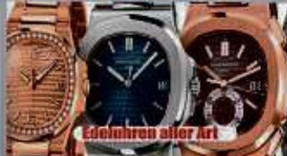
Edeluhren aller Art

Ihre Vorteile: ✓ kostenlose Beratung ✓ kostenlose Wertschätzung ✓ transparente Abwicklung ✓ Bargeld sofort