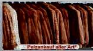
Pelzankauf aller Art*