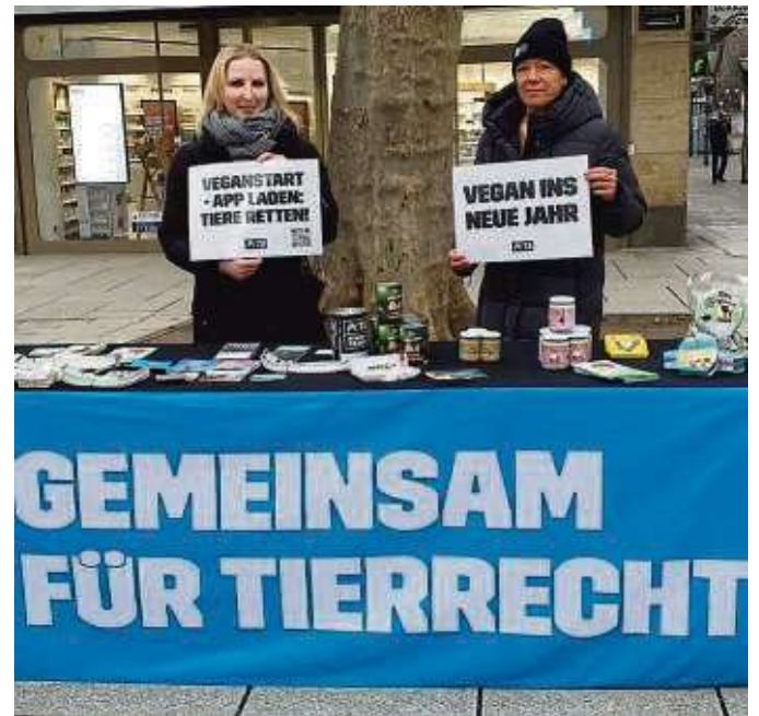
Am zugehörigen Stand gibt es Infomaterial und leckere Kostproben: Von Kokos-Hummus über Erdnuss-Schoki und Jackfruit ist alles dabei.

Tieren in der ökologischen Haltung geht es meist nicht viel besser. Auch sie gelten als Ware, werden nicht annähernd artgerecht gehalten und in den gleichen Schlachthäusern getötet – weit vor Erreichen ihrer möglichen Lebenserwartung. Dort sind Fehlbetäubungen an der Tagesordnung. Je nach Betäubungsart liegt die Rate der unzureichenden Betäubung laut Bundesregierung bei Schweinen zwischen 3,3 und 12,5 Prozent und bei Rindern zwischen vier und neun Prozent, wenn sie getötet werden. Das sind jährlich weit über fünf Millionen Schweine und mehr als 300.000 Rinder – die Dunkelziffer dürfte nach Petas Schätzung weit höher liegen. Hinzu kommen unzählige getötete Fische und andere Meeresbewohner.