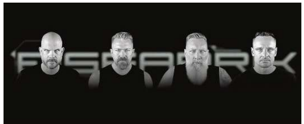
Eisfabrik kommen mit dem neuen Album „Götter in Weiß 2024“ auf Tour und spielen auch im Bett.