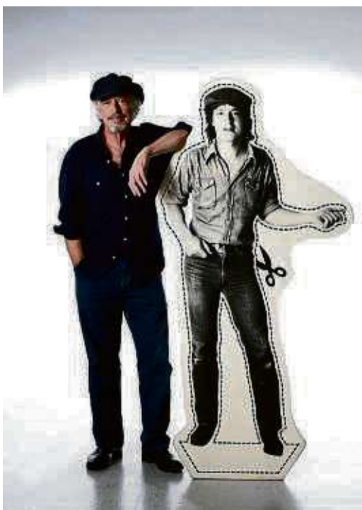
Wolfgang Niedecken und seine Band Bap kommen im November nach Frankfurt.

Hits wie „Verdamp lang her“, „Kristallnaach“ oder natürlich auch „Do kanns zaubere“ brennen sich unwiderruflich in die Ohren und Herzen ihrer