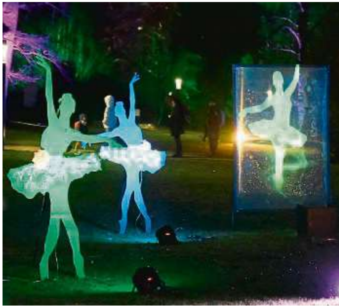
Bunte Ballerinas erleuchten den Palmengarten, eine dreht sich sogar.

Über der Brücke am Bootsweiher senden rot leuchtende Herzsilouetten Signale der Liebe. Wenn zum Rhythmus von Beethovens „Für Elise“ Quader und