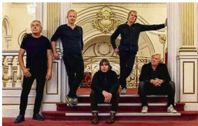
The Analogues spielen im September in der Jahrhunderthalle.

Karten zu ab 58,25 Euro gibt's online auf myticket.de.