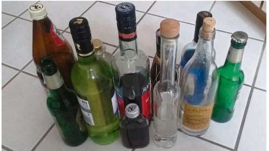
Um Komasaufen und extremem Alkoholkonsum entgegenzuwirken, ruft die DAK wieder zu der Kampagne „bunt statt blau“ auf, bei der Kinder Plakate gestalten können.

„Wir freuen uns darüber, dass immer weniger Jugendliche nach dem Rauschtrinken stationär in einer Klinik behandelt, werden müssen. Nach wie vor ist jede Alkoholvergiftung eines jungen Menschen eine zu viel“, sagt Gregor Reitz von der DAK-Gesundheit in Frankfurt. „Deshalb setzen wir weiter auf Aufklärung und setzen unsere erfolg-