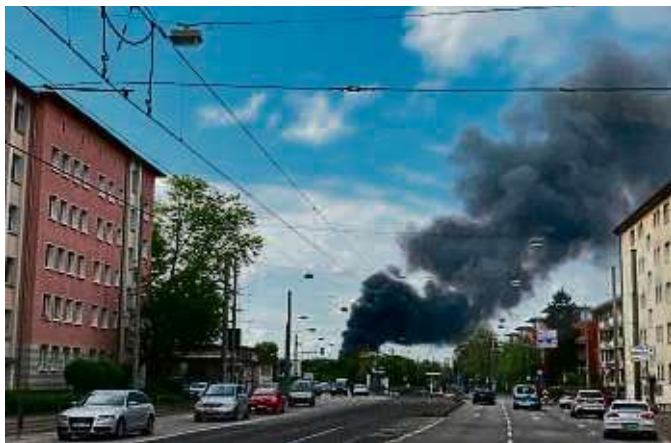
Die Rauchsäule an der Einsatzstelle.

Griesheim (red) – Nach dem Unwetter, das in Frankfurt gewütet hat, war die Feuerwehr gefordert. Viele Notrufe erreichten die Leitstelle. Zahlreiche Menschen meldeten auch Flammen und Rauch aus einer Lagerhalle in der Lärchenstraße. Sofort wurde Großalarm für die Berufsfeuerwehr und die Freiwilligen Feuerwehren ausgelöst. Den Einheiten bot sich vor Ort folgendes Bild: Flammen und tief-schwarzer Rauch hatten die Lagerhalle bereits fest im Griff. Die Rauchwolke war von verschiedenen Orten aus deutlich zu sehen. Es wurden umgehend Löscharbeiten mit mehreren Wasserwerfern eingeleitet. Ebenfalls wurde Wasser von vier Drehleitern auf den Brand abgegeben. Weitere Einheiten mussten nachalarmiert werden, um die Lage in den Griff zu bekommen. Unter anderem kamen spezielle Einheiten der Freiwilligen Feuerwehr zum Einsatz, um den hohen Bedarf an Löschwasser zu decken. Es wurde Wasser aus dem Main entnommen und zur Einsatzstelle gefördert. Die Werkfeuerwehr Allessa Chemie aus Fechenheim unterstützte die