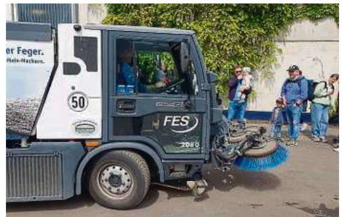
Eine Fahrt mit der Kehrmaschine ist für die kleinen Besucher des Komposttags ein großes Abenteuer.