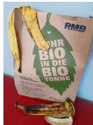
Zur Biochallenge verteilt die FES Papiertüten an Haushalte in Fechenheim und Griesheim.

Um diese Werte möglichst gering zu halten, wird der organische Abfall am besten schon in der Küche vom restlichen Müll getrennt. „Bioplastiktüten aus Maisstärke sollten nicht genutzt werden, um den Bioabfall zu sammeln. Denn diese können in der Biokompost-Anlage nicht verrotten. Besser sind Biotüten aus Papier oder einfach Zeitungsbögen“, teilt die FES mit. Je besser der Bioabfall getrennt wird, desto mehr hochwertiger Kompost kann hergestellt werden und schädliches Plastik gelangt nicht über den Kompost in die Böden. Damit geht die diesjährige Biochallenge langsam zu Ende. Anfang Juni wird der Siegerstadtteil prämiert.