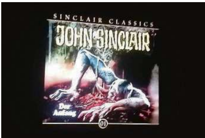
Das einzige Bild, dass zu der Horrorgeschichte auf der Leinwand gezeigt wird, lässt Schauriges erahnen und kurbelt die Fantasie an.