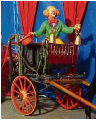
Das Zirkus-Museum zeigt historische Exponate und alte Wagen.