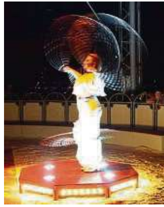
Die Reifen werden in schwindelerregender Schnelle umhergewirbelt.