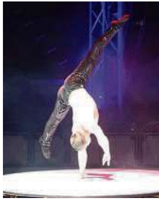
Totale Selbstbeherrschung: Kunststücke auf einer Hand stehend.