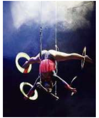
Freihändig, nur durch Körperspannung, mit Ringen am Trapez.

Circus Gebrüder Barelli noch bis Pfingstmontag am Ratsweg zu Gast