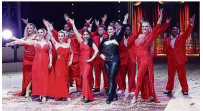
Das Zirkus- und Artistenteam hat sich für den Schlussapplaus schick gemacht – und wird vom Publikum ordentlich gefeiert.