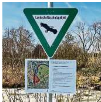
Die neu installierte Beschilderung am ehemaligen Höchster Wehr.

„Wir haben dort mehrere geschützte Tierarten, die dort ihren