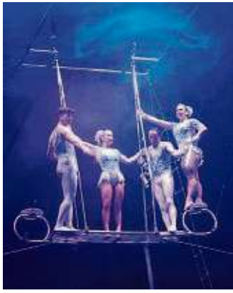
Die Artisten machen sich bereit für ihre Sprünge durch die Manege.