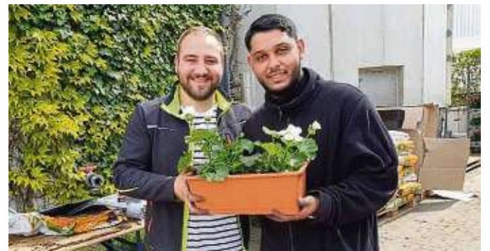
Die FES-Gärtner sind im Dauereinsatz: Sie verteilen kostenlose, bepflanzte Blumenkästen und die Nachfrage ist riesig.