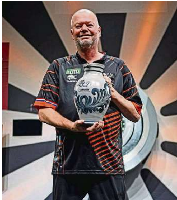
Sieger der Darts Open: Raymond van Barneveld mit dem Riesembemmel.